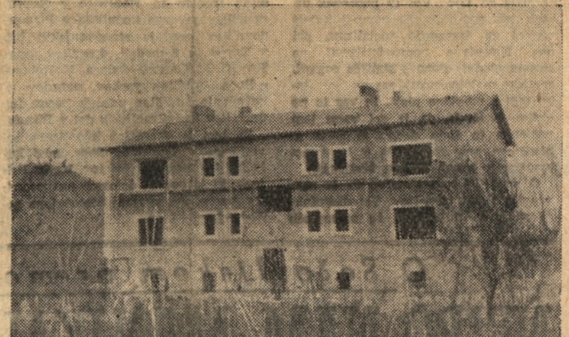
Velik razvoj industrije je privabil v naša središča nove ljudi. Zanje zidamo stanovanjske hiše

Vzporedno s preobrazbo zemlje in kulture gre tudi preobrazba naših vasi. Zidajo zadrugne domove, središča kulturnega življenja, podeželja. Električna prijava v vasi. Rastejo nove šole. Poleg tistih, ki so bile zgrajene v zadnjih letih, smo dobili letos na podeželju koprskega okraja še dve: v