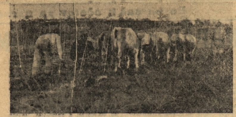
Konec so deževna vremena in naš kmet je spet zora, da nadoknadi to, kar ni mogel zaradi dežja. Na sliki vidite prišace kmetijske kmetje pri oranju

Odgovor: Ogljikov žvepec je rumenkasto, silno hlapljiva tekočina. Če pride na zrak, vidno izginja in se izpreminja v hlap, ki so človeškemu organizmu škodljivi. Je gorljiva, zato moramo biti pri opravičku z njo skajno previdni. Če pride ta tekočina v stik z ognjem, se takoj vžame in če se to zgodi v sodu, eksplozija. Zato je vsako kajenje, če delamo z njo, prepovedano. Uporablja se pri razkuževanju zemlje — za uničevanje različnih škodljivih organizmov, ki se s njimi nahajajo: hroščev, ogrev, strumbramorjev, trnih uši itd. Navadno se uporablja za vžigavanje te