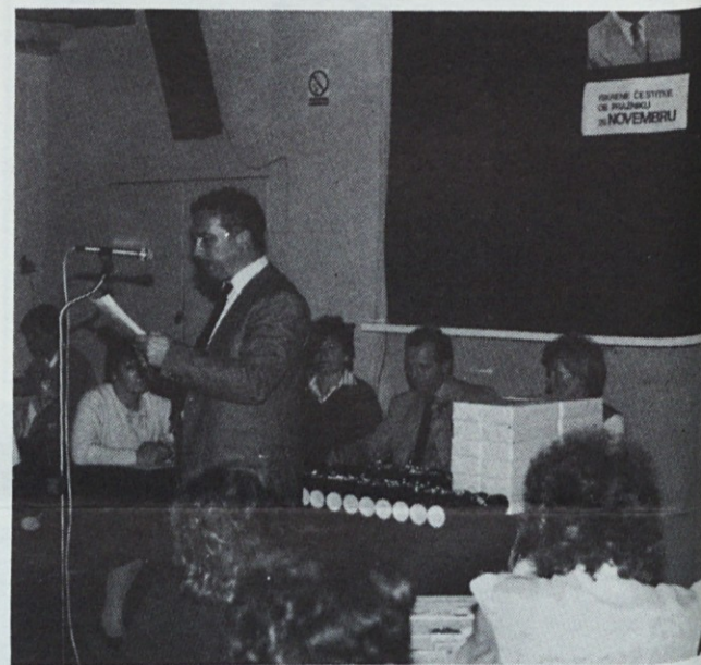
Dosedanji predsednik izvršnega odbora sindikata tozda Šumi je predstavil delo te organizacije v minulih dveh letih.