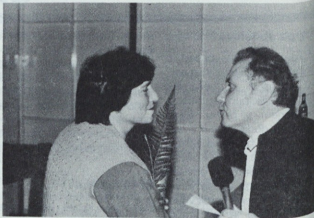
To so letošnji jubilaranti iz tozda Šumi!

Podelitev jubilejnih priznanj v tozdu Pekarna Vrhnika.