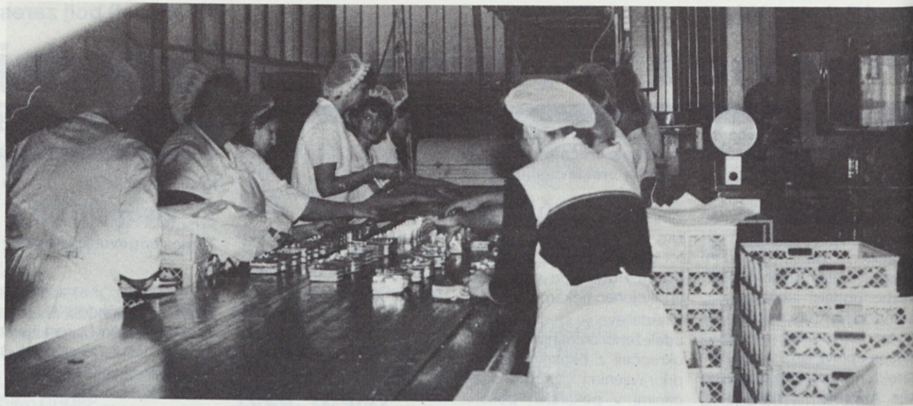
Proizvodnja mehkega peciva se je znašla po sprejetju protiinflacijskih ukrepov v težavah, saj se obetajo velike izgube...