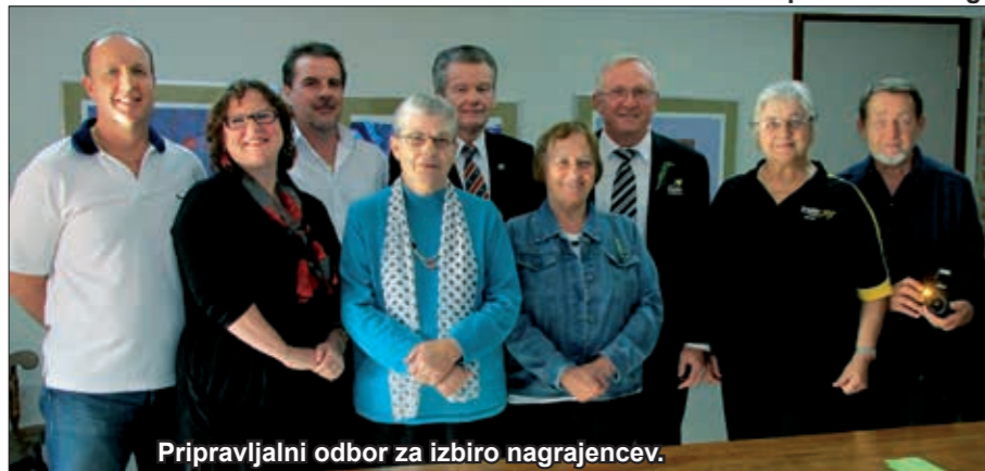
Pripravljalni odbor za izbiro nagrajencev.

Pripravljalni odbor Triglav Mounties Slovenian Community Awards 2016