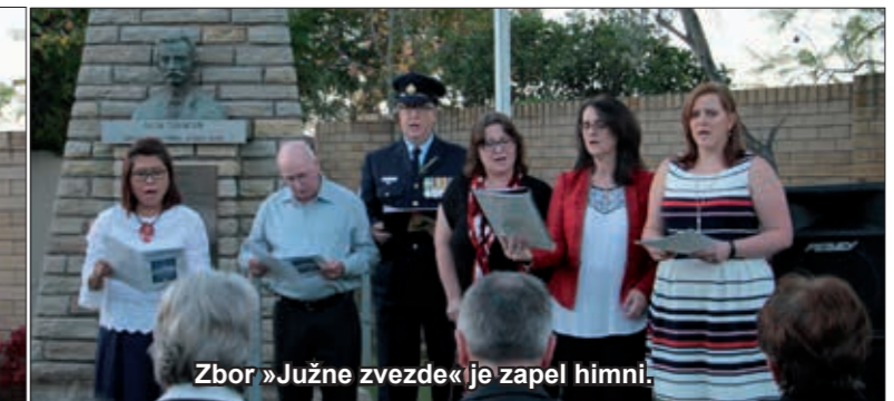
Zbor »Južne zvezde« je zapel himni.