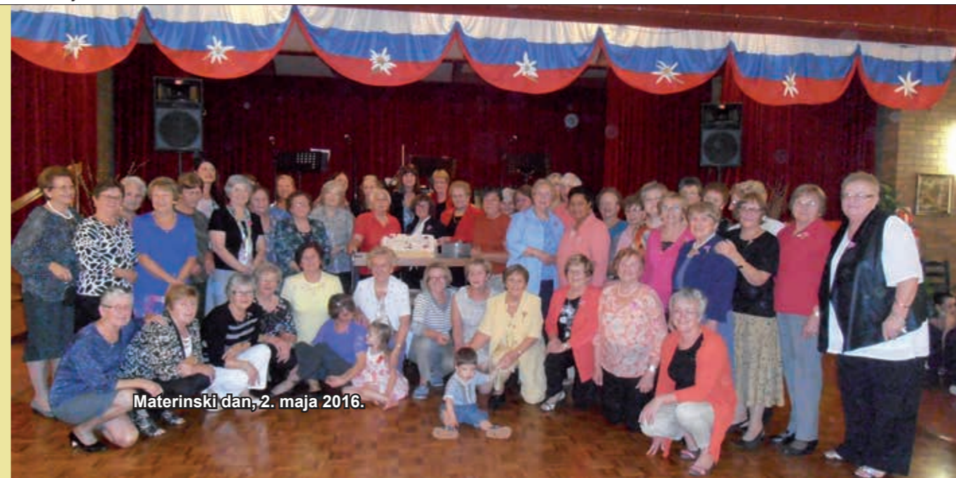
Materinski dan, 2. maja 2016.