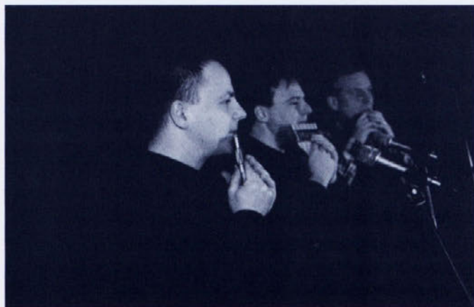
Ansambl Kurja koža s trstenkami