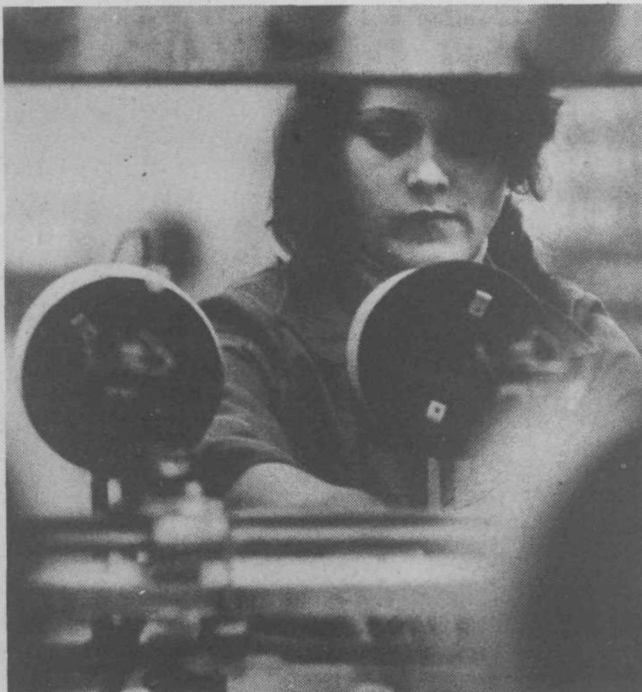
Delavka v Julonu