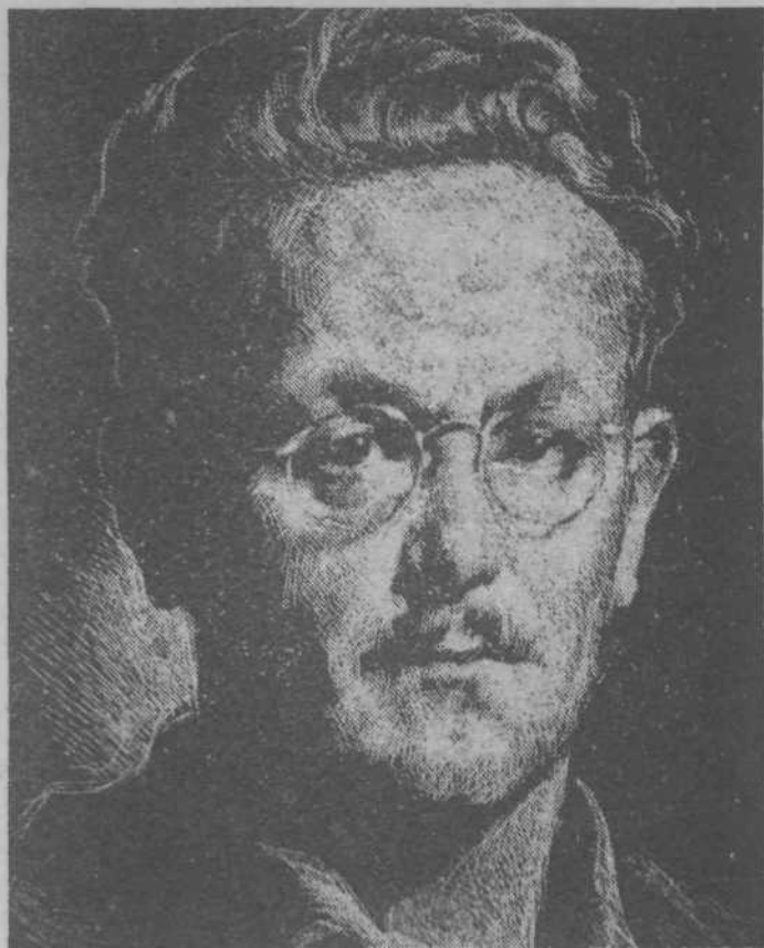
Portret Edvarda Kardelja v globoki jedkanici, nastal v Bazi 20 leta 1944

(Edvard Kardelj, Smeri razvoja političnega sistema socialističnega samoupravljanja, 1. izdaja, str. 213 — 214)