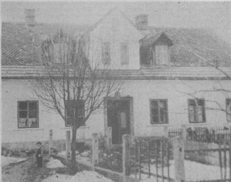
Hiša na Zaloški cesti — pred vojno je imela št. 127 a — kjer je od jeseni 1938 do poletja 1939 ilegalno bival Edvard Kardelj. Prim. Fotografski dokumenti v boju KPS V2, str. 174

Konec leta 1938 sem zvedel, da je prišel k nam kot naš sorodnik z dežele stanovat »neki študent Jože«. Ostal je pri nas do