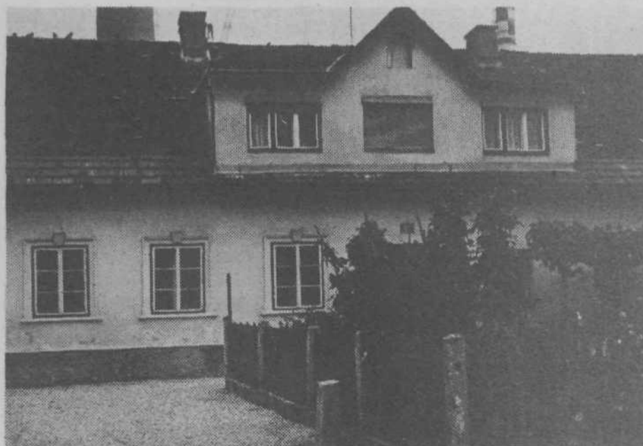
Ista hiša — sedaj Zaloška c. št. 119 — slikana novembra l. 1980.