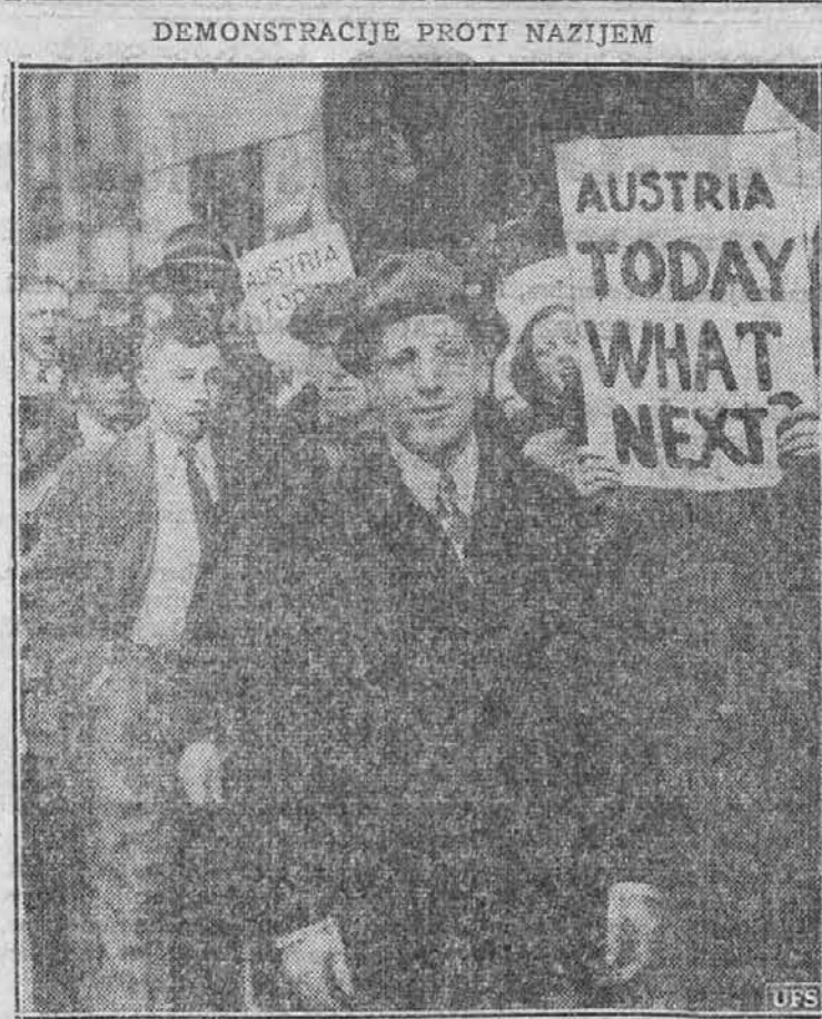
Zasedba Avstrije je našla svoj odmev tudi v Ameriki. Zgoraj vidimo prizor iz protestnih demonstracij, ki so se nedavno vprizorile pred nemškim konzulatom v Detroitu.

Zadnje dni opazujemo v slovenski javnosti prav zanimiv pojav. Osebe, ki so predstavile "heil" v "zdravo", se vesele Hitlerjevega pohoda iz kulturno bojnihih ozirov. Da je le potkolkel avstrijski "klerikalizem"! Ta kulturnobojna nastrojstvo je bila že v Avstriji nekaterim več kot slovenska stvar. Zakaj je del Slovencev glasoval za zloglasni centralizem in še danes zagovarja "nacionalno edinstvo" in hoče zbrisati slovenski narod z običaja zemlje? Dobro vedo, koliko škode v kulturnem in gospodarske oziru nam je napravil nesrečni centralizem, pa ga vendar še goje. Od kod to? To vse za to, ker mislijo, da bodo s centralizmom prej ubili "kle-