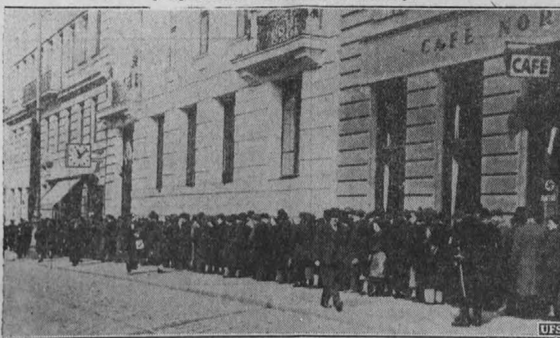
Judje v Avstriji vedo, da jim ni nič dobrega pričakovati, odkar so naziji zasedli deželo, in tako skušajo pobegniti, kamor kdo more. Gornja slika kaže dolgo vrsto, ki je čakala pred poljskim konzulatom na Dunaju, da si izposluže vizo za preselitev na Poljsko.