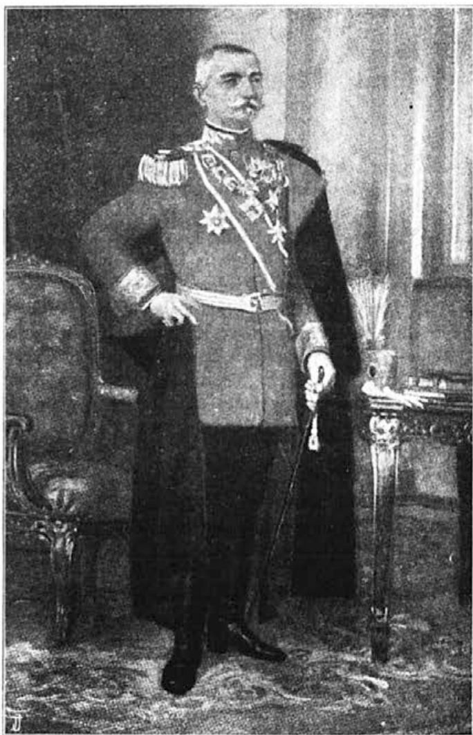
† Kralj Peter I. Osvoboditelj.