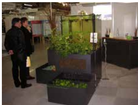
Slika 5: Uporaba akvaponike v učilnici in kot centralni objekt na šolskem hodniku v Švici v okviru projekta Play-with-water ( www.play-with-water.ch ).

V Biotehniškem centru Naklo ( www.bc-naklo.si ) izobražujejo dijake poklicnih in strokovnih programov s področja gospodinjstva, kmetijstva, živilstva, hortikulture in naravovarstva. V okviru projekta AQUA-VET so ob šolskem poslopu v letošnjem letu zgradili sistem akvaponike v rastlinjaku, ki predstavlja učno orodje pri izobraževanju dijakov. Dijaki se spoznavajo z gradnjo in vzdrževanjem sistema in se učijo o gojenju rastlin in rib z namenom postati usposobljeni "akvaponični kmetovalci". V okviru projekta je v pripravi tudi podporno gradivo za učitelje in pripadajoči učni listi za dijake na temo kroženja vode v akvaponiki, gojenja rib in rastlin ter spremljanja fizikalno-kemijskih lastnosti vode, ki bodo v pomoč pri samem učnem procesu. Šola s tovrstnim izobraževanjem podpira tudi razvoj t. i. "zelenih delovnih mest", ki postajajo vedno bolj pomembna za prihodnost. AQUA-VET je nadgradnja zaključnega projekta Play-with-water, ki je bil namenjen osnovnim šolam, v sedanjem projektu pa so aktivnosti osredotočene na poklicno in strokovno raven izobraževanja.