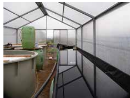
Slika 6: Gradnja rastlinjaka v Biotehniškem centru Naklo in priprava rastlinske grede ter bazenov za ribe.