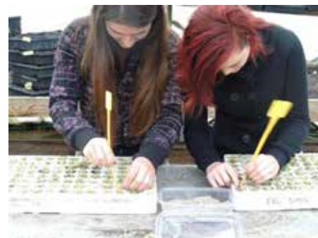
Slika 7: Dijaki hortikulture v Biotehniškem centru Naklo so zasejali rastline za rastlinske grede in poslušali predavanje o vzdrževanju sistema akvaponike.