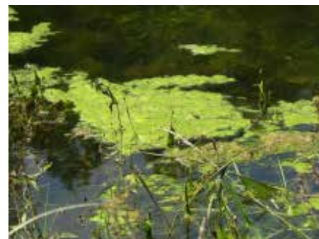
Slika 1: Evtrofikacija povzroča cvetenje alg.

Evropska unija je leta 2002 pripravila smernice za razvoj oziroma za trajnostno prihodnost akvakulture v Evropski uniji. Smernice so bile sprejete leta 2002 in nazadnje dopolnjene letos. V skladu s temi smernicami mora razvoj akvakulture temeljiti na okoljsko sprejemljivi, ekonomsko upravičeni in socialno ter demografsko stabilni akvakulturi z uvajanjem novosti in spoznanj ob upoštevanju dobrih gojitvenih pogojev, s čemer zagotavljamo tudi trajnostno akvakulturo. Akvaponika, ki združuje akvakulturo rib z gojenjem rastlin v hidroponiki v zaprtem krožnem sistemu,