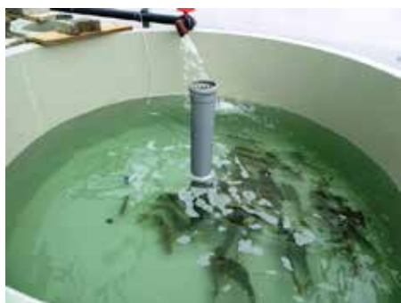
Slika 8: Letošnji jesenski pridelek v akvaponiki v Biotehniškem centru Naklo: krapci v bazenu in solata ledenka v rastlinski gredi.