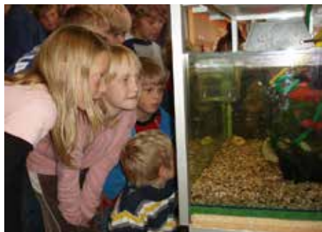
Slika 4: Uporaba akvaponike v učilnici v osnovni šoli Ålandsbro na Švedskem v okviru projekta Play-with-water ( www.play-with-water.ch ).