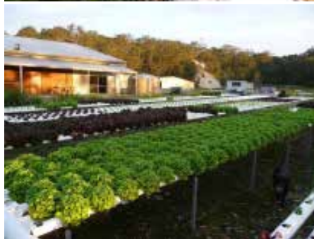
Primer gojenja zelenjave v akvaponiki v Švici ( www.aquaponic.ch ) in v Avstraliji ( www.tai-lormadefishfarms.com.au ).