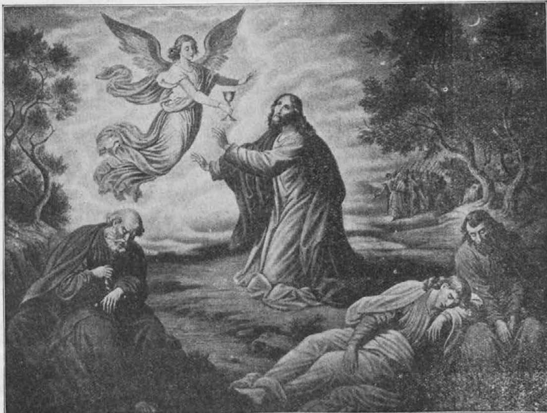
Jezus na Oljski gori.