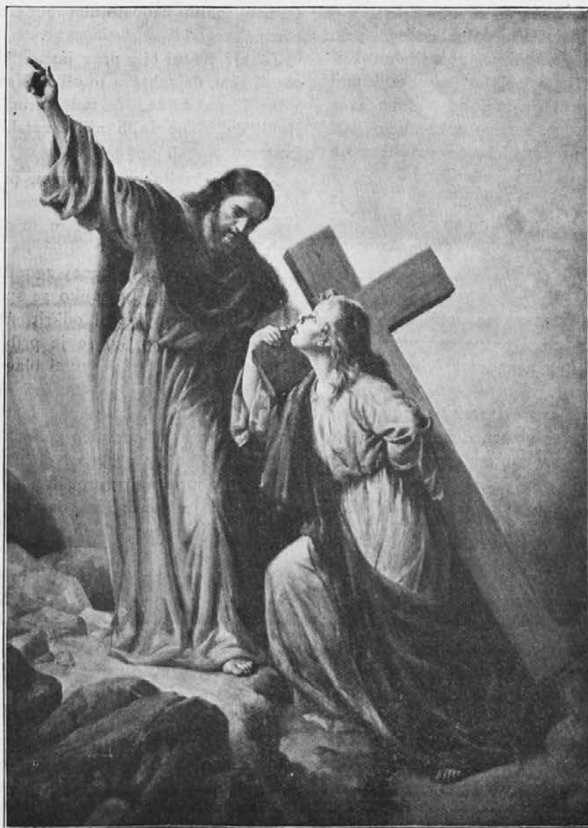
Le pot križa vede v slavo! Duša, hrabro dalje!

“Znano ti je, da v dijaških letih nisem bil nikoli veren; že kot otrok sem bil brezverec. Kako tudi? Komaj štiri leta sem štel, ko sem zgubil drago mamico. Oče, sicer dober človek, je živel le za svojo službo in ni imel o vzgoji otrok niti najmanjšega pojma, zato me je popolnoma prepustil v oskrbo poslom. Kadar mi je hotel skazati kako posebno ljubav, me je vzel s seboj v gostilno, koder sem se navadil onih brez-