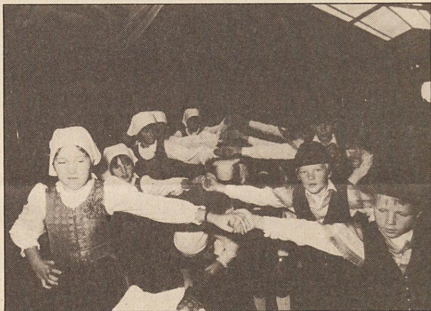
Otroška folklorna skupina SPD „Trta“ iz Žitare vas.

S tem pa smo že začrtali naše cilje, naše delo za bodočnost: samozavest in zaupanje v lastno moč, enotnost, idealizem ter vztraj-