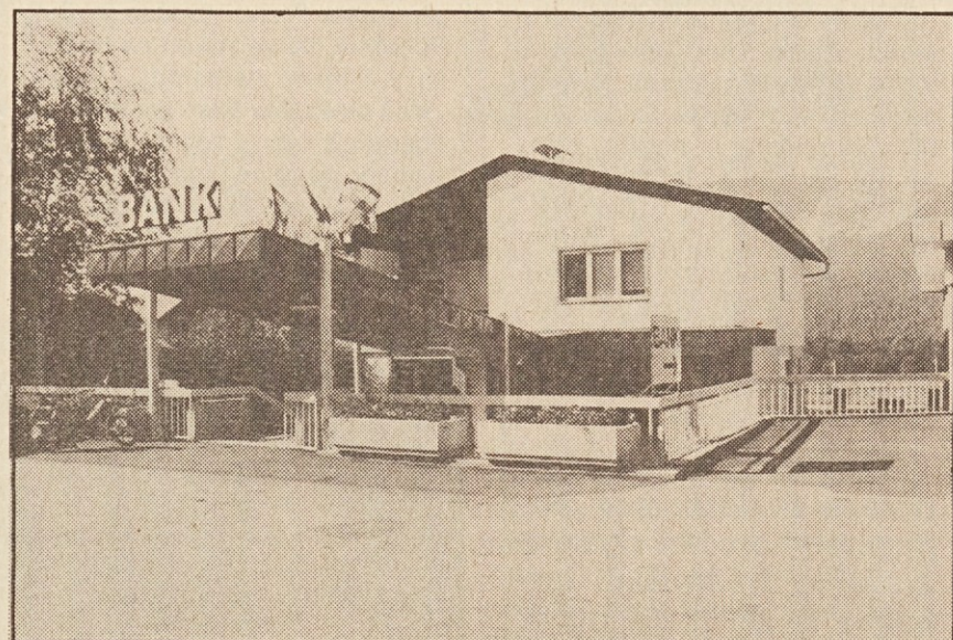
Zgoraj: pri bančnem okencu. Spodaj: hiša Posojilnice, moderna, a skladna z okoljem.