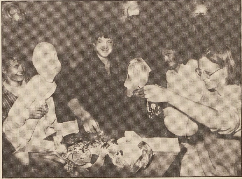
Pri delu z lutkami sije lutkarjem veselje z obrazov.