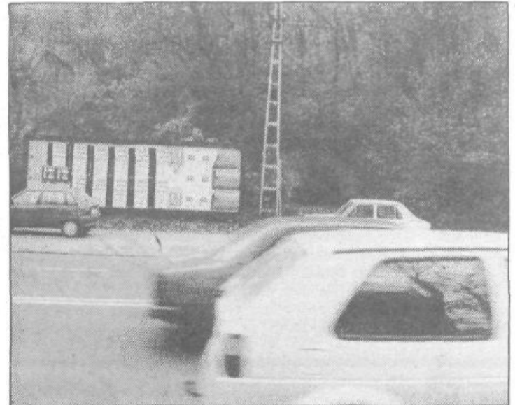
Glede na zaklonišče ob Celovski lahko trdimo, da atomske vojne ne bo! Zaklonišče so namreč pristojni popolnoma zanemarili. To seveda ne moremo trditi z zanesljivostjo, kajti drevje pred zakloniščem je lahko tudi samo spretna kamuflaža ...