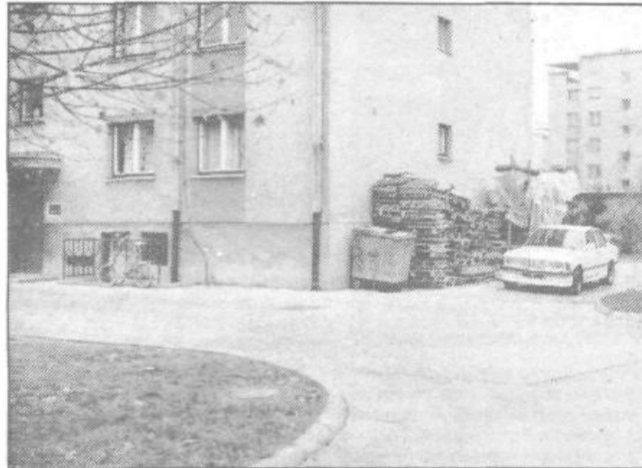
Na Goriški ulici so se dobro pripravili za novo kurilno sezono. Očitno bo zima zelo huda, saj je paleta palet zel pestra in visoka. Prebivalci Goriške, ki so si pripravili kurjavo za zimo, so verjetno zaposleni v kakšnem transportnem podjetju, kjer nisto tako natančni glede števila palet ...