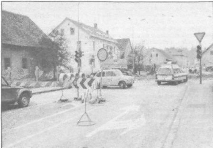
Vodnikova cesta ni znamenita samo po Vodnikovi domačiji, ampak zadnje čase tudi po prej imenovani cesti, ki je nikakor ne morejo dokončati ... Že več mesecev po njej prekladajo cevi in kopljejo jarke, tako, da se bojimo, da bo na tej cesti nastalo »podzemlje«, ki je nad njo, vsaj kar se gradnje tiče, najbrž že nastalo ...