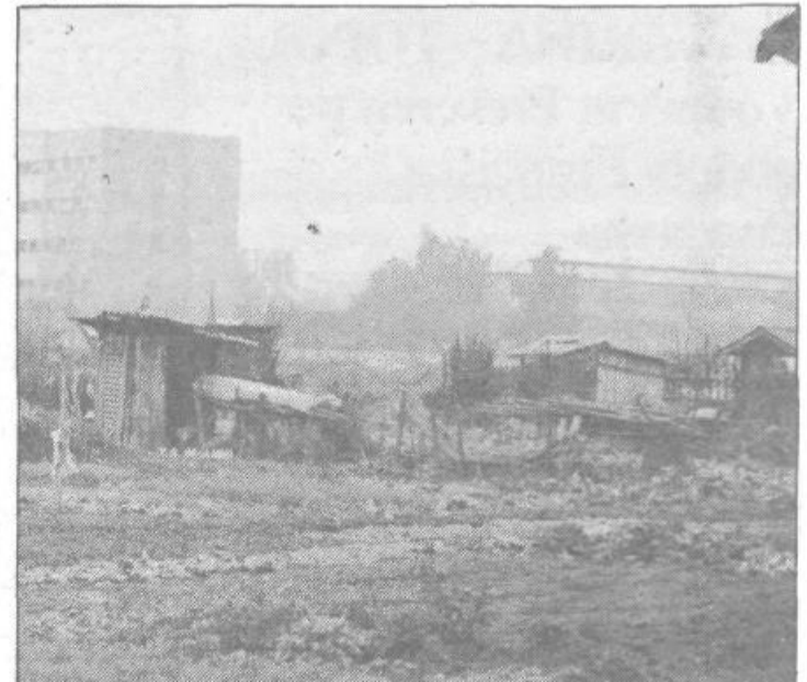
O vrtičkarji in vrtičkih smo v Tribuni že veliko pisali. Enkrat o tem, da nismo ustrezno organizirani, drugič pa o njihovih prostorskih težavah. Žal doslej ni še nihče spregovoril o njihovih »krasnih« zatočiščih sredi vrtičkov. Toda tudi o barakah bi kazalo kdaj spregovoriti, saj se »krasno« vklapljuje v nova, sodobna naselja ...