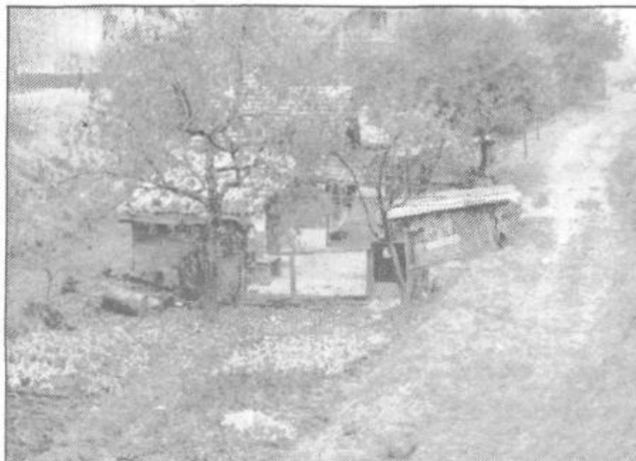
O barakah, ki so na posnetku iz okolice Litostroja, smo že poročali. Ponovno jo objavljamo predvsem zato, da bi lahko bralci ugotovili, da so se razmere bistveno izboljšale. Podjetni stanovalci so si namreč »prizidali« kar precej novih objektov ...