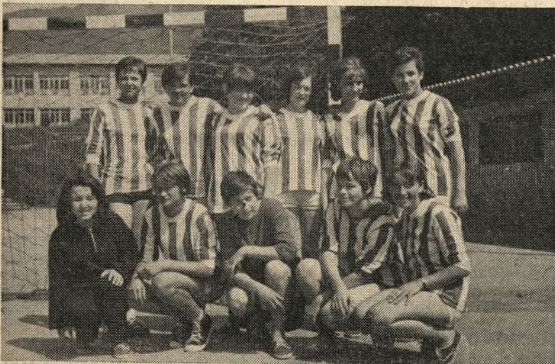
Rokometna ekipa »Steklarja«

osvojila 10 točk in zavzela 9. mesto med desetimi slovenskimi ženskimi rokometnimi ekipami. Poudariti velja še posebej uspeh, ki so ga dekleta dosegala na odprtem