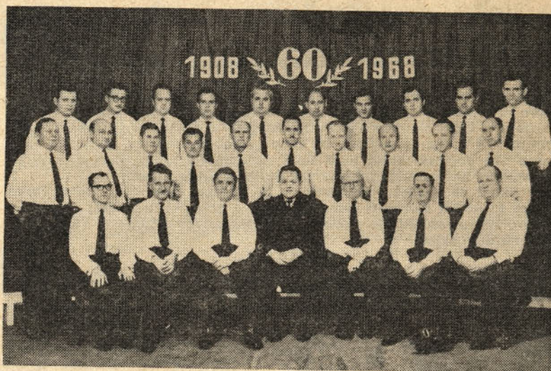
Pevski zbor »SVOBODE« Hrastnik ob 60-letnici delovanja