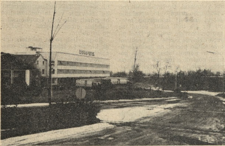
Nova hala firme Rastal