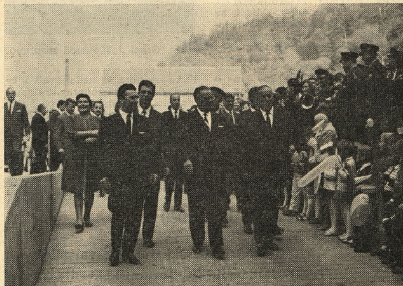
Tov. TITO in spremstvo na obisku v našem kolektivu