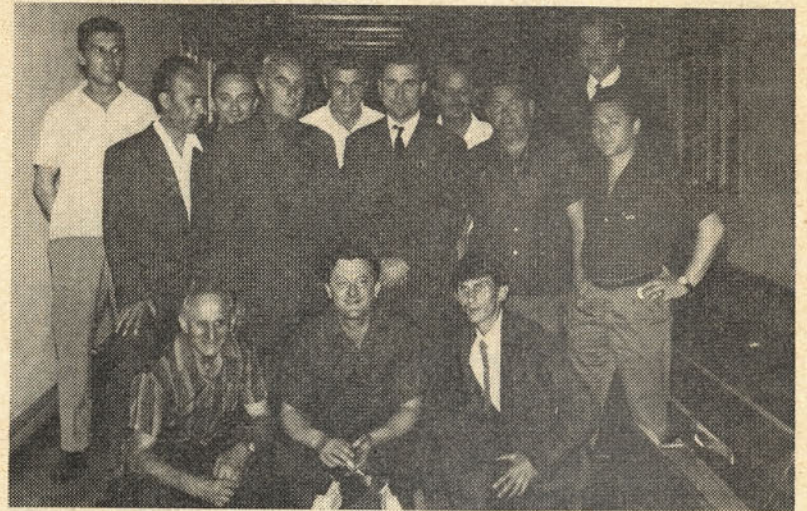
Naši najboljši kegljači

organizacijami v spodnjem delu, da se ponovno ustanovi Športno društvo »Bratstvo«, ki naj vključuje vse panoge, financiranje pa naj se uredi tako, da del sredstev, ki jih