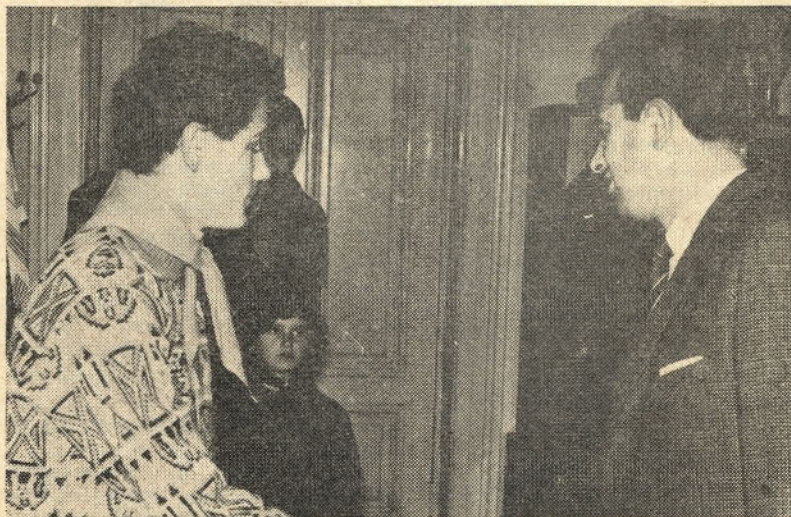
PIONIRJI HRASTNIKA ČESTITAJO ČLANOM KOLEKTIVA STEKLARNE HRASTNIK 29. NOVEMBER, DAN REPUBLIKE

Srečno novo leto 1969 želi vsem članom ZM Steklarne