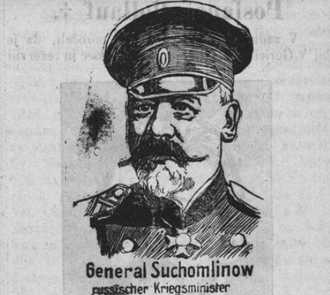
General Suchomlinov rusischer Kriegsminister

Pred nekaj časom so prinesli časopisi vest, da je ruski vojni minister general Suchomlinov v katerega sliko danes prinašamo, odstopil. Kmalu pozneje so prišla zopet poročila, da ta odstop ni imel političnega ozadja, marveč da je Suchomlinov kot vojni minister na patentirani ruski način sleparil in kradel, kakor sraka. Vojni minister na Ruskem seveda ne ukrade par starih škornjev ali rabljene spodnje hlače. Kadar že krade, tedaj krade cele vagone vojnega materijala, krade vrednosti, ki segajo v