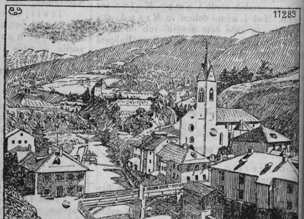
Zum Riesenbrand in Deutsch-Matrei.

Prinašamo sliko mesta Deutsch-Matrei, ki leži ob gori Brenner. Prijazno to mestec zadela je pred kratkim huda neareča. Iz neznanega vzroka nastal je namreč ogenj, ki se je vsled viharja izredno hitro razširil. Skoraj polovica prekrasnega mesteca bila je v prah in pepel spreminjena. Pravijo, da je okoli 80 poslopij pogorelo. V posebnih vlakih pripeljalo se je gasilce in vojaštvo, da so v težkem trudu po daljšem času grozoviti požar zadušili. Škoda je seveda ogromna.