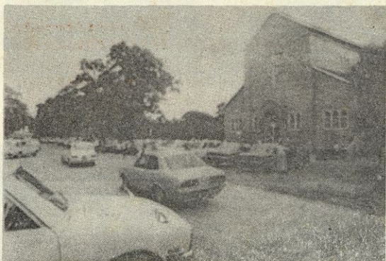
Cerkev sv. Ignacija