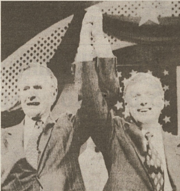
George Bush in podpredsednik Dan Quayle

Volivci imajo dober spomin in mu niso odpustili neizpolnjenih obljub, zaradi katerih so se družbeno-gospodarske razmere močno poslabšale - delovna mesta so v nevarnosti, šolski sistem škriplje, zdravljenje je predrago. Pred svojim odločilnim govorom v Houstonu je napovedal »nove ideje, kakršnih še nismo preizkusili«. Kakšne, se ne ve, vemo pa, da bi rad prepusil zdravstvo izključno zasebni konkurenci in da bi med drugim tudi rad znižal davke; to pa bi potisnilo še bolj kvišku zvezni primanjkljaj, ki se že približuje 400 milijardam dolarjev, sploh pa destabiliziralo finančne trge, kakor poudarjajo ugledni ekonomisti. Ne samo, ob morebitnem drugem mandatu bi bil lahko Bush zaradi izjemno težkih razmer prisiljen celo še povišati davke, kajti le tako bi pridobili 60-90 milijard dolarjev letno, ki so nujne, da se deficit zmanjša do »znosne« mere.