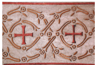
Sgrafitto tehnika na stropu meniške krstilnice.

Konec oktobra pa bo izšel vodnik - knjižice z naslovom Po sledih Plečnikove dediščine v občinah Domžale, Kamnik, Komenda, Trzin in Mengeš, ki nastaja v sodelovanju z Zavodom za spomeniško varstvo Slovenije in bo izšel v okviru zbirke Kulturni in naravni spomeniki Slovenije. Vsebinsko sta se priprave vodni-