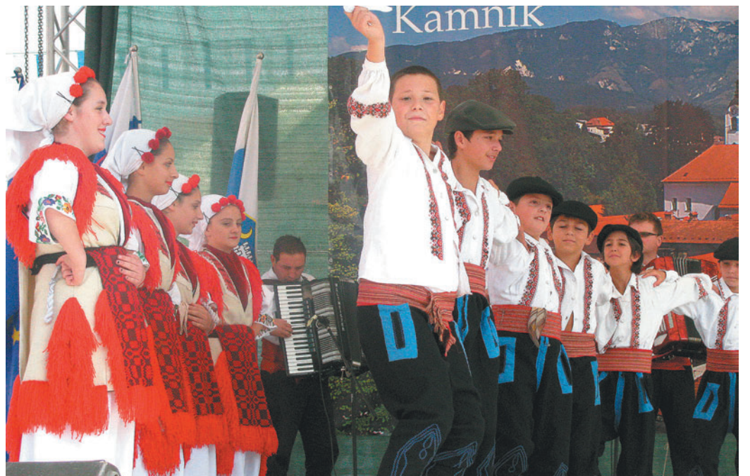
Zadržanost gledalcev so zagotovo stopili mladi folkloristi iz Makedonije, ki so s svojimi ritmi, plesnimi koraki in barvitostjo noš marsikoga zazibali v gibanje.

V soboto so obiskovalci na Šutni lahko prisluhnili 5. Tekmovanju harmonikarjev iz vse Slovenije, se na Glavnem trgu zazibali ob nastopih otroških in odraslih folklornih skupin, popoldan preživeli v družbi kamniških glasbenih, pevskih in folklornih skupin ter večer zaokrožili z zabavo Okroglih muzikantov in Galopa. Proti večeru je na polnem osrednjem prizorišču zaplesala folklorna skupina DU Kamnik, za še bolj