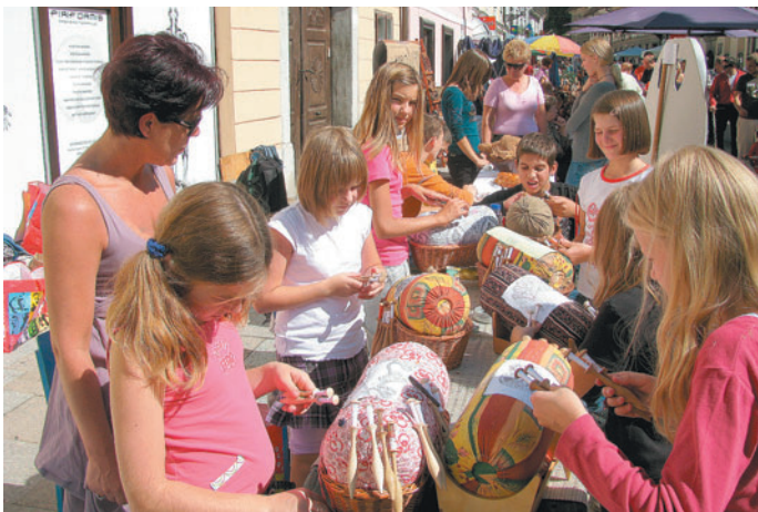
Krožek klekljaric iz OŠ Marija Vere: »Kamničanom predstavljamo umetnost klekljanja, ki se ga 70 učencev uči v našem krožku. Klekljati se nam zdi zabavno, oblikujejo se lepi izdelki, ponavadi jih vsi ogledujejo in občudujejo, pa še nekaj novega se lahko nauči. Pripravljamo se na šolsko tekmovanje in upamo, da bomo dovolj dobri za državno tekmovanje v Idriji.«