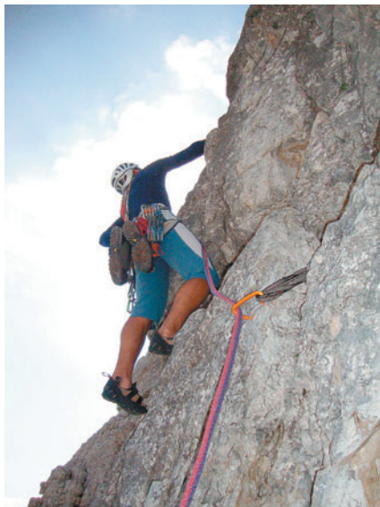
V smeri »M speciale« v Malem Lagazuoiu (Picolo Lagazuoi).

Od 17. do 23. julija je v Dolomiti potekal tabor Alpinističnega odseka Kamnik, ki se ga je udeležilo 15 članov. Kampirali smo v kampu Sass Dlacca pod prelazom Falzarego. Kamp je bil idealno izhodišče za plezanje v stenah gora Col de Bos, Lagazuoi, Hexenstein, stolpi Falzarega, Tofana di Roses, Cinque Torri itd. Tisti, ki smo bili v Dolomiti prvič, smo odprtih ust »zijali« v množico sten, ki so nas obdajale. Petnajst minut vožnje iz kampa in že smo bili na izhodišču posameznih vzponov. Dostopi pod stene so bili precej krajši, kot smo jih navajeni iz naših hribov, skala pa precej bolj kvalitetna. Preplezali smo kar nekaj smeri do vključno VI težavnostne stopnje.