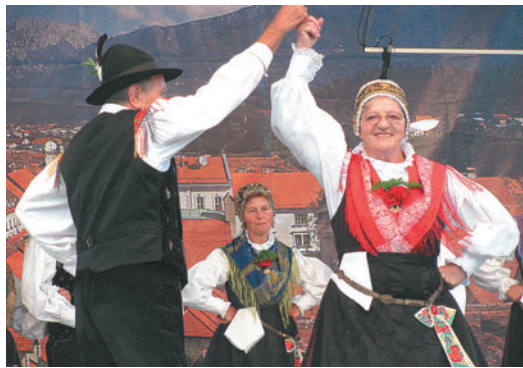
Folklorna skupina Društva upokojencev Kamnik je v soboto zvečer s predstavitvijo gorenjskih plesov požela velik aplavz med gledalci.

V nedeljo so po budnici Mladinskega pihalnega orkestra Domžale na velikem odru zaplesale zanimive folklorne skupine iz Portugalske, Srbije, Italije in Makedonije. Vsaka skupina je po svoje že v dopoldanskih urah navduši-