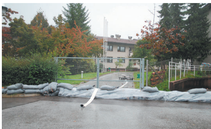
Varovalni nasipi in protipoplavne zaščite pred vdorom vode v kletne prostore so bile pri nekaterih najbolj ogroženih objektih nameščene že v petek v zgodnjih popoldanskih urah, tako tudi pri Domu starejših občanov v bližini reke Nevljice.