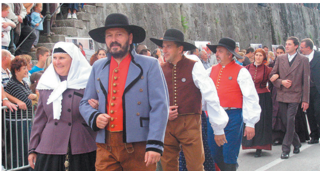
Posebnost letošnje povorke je bila predstavitev 40 parov, ki so s svojo opravo prikazali oblačilno dediščino glede na čas, prostor, stan.