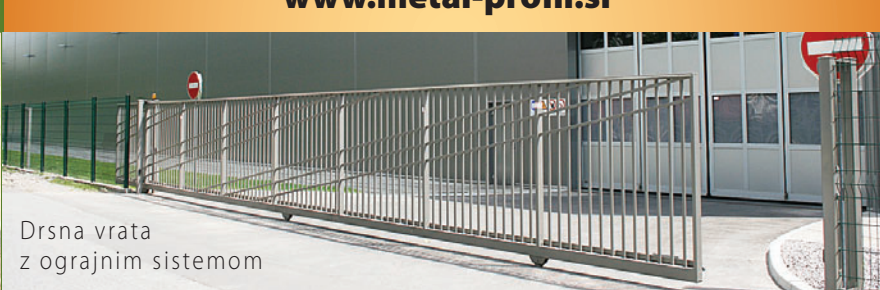
Drsna vrata z ograjnim sistemom