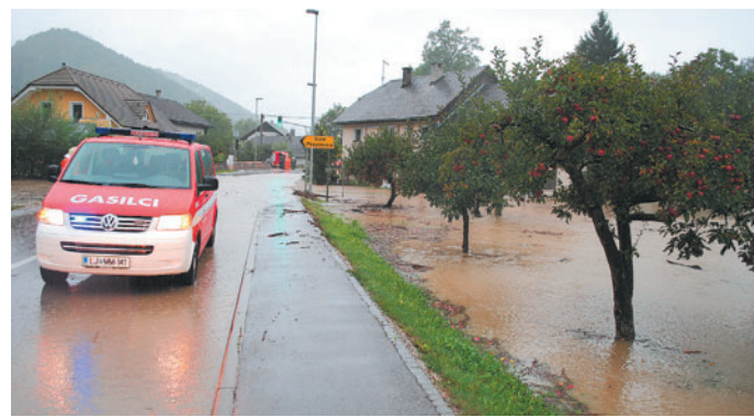
Narasa Nevljica je poplavlila regionalno cesto v Šmartnem, ki je bila zato več ur zaprta.