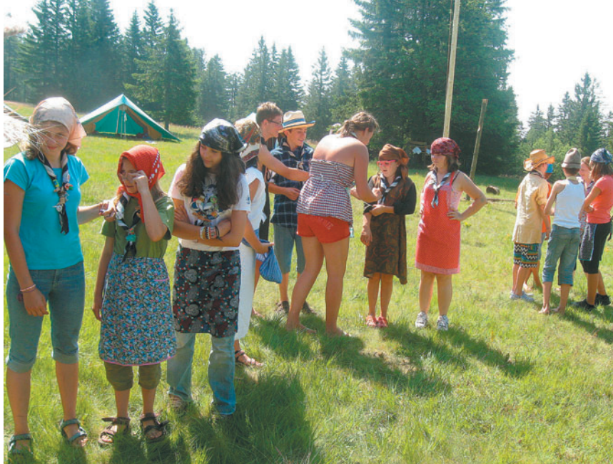
Pripravili smo tudi butalske olimpijske igre v oblačilih naših starih mam in atov.

Zanimiv je bil tudi izhod ali hajk. To pomeni, da smo sami brez voditeljev in z zemljevidom, kjer je bil označen cilj, za 24 ur odšli iz tabora in prespali na bližnjih kmetijah.