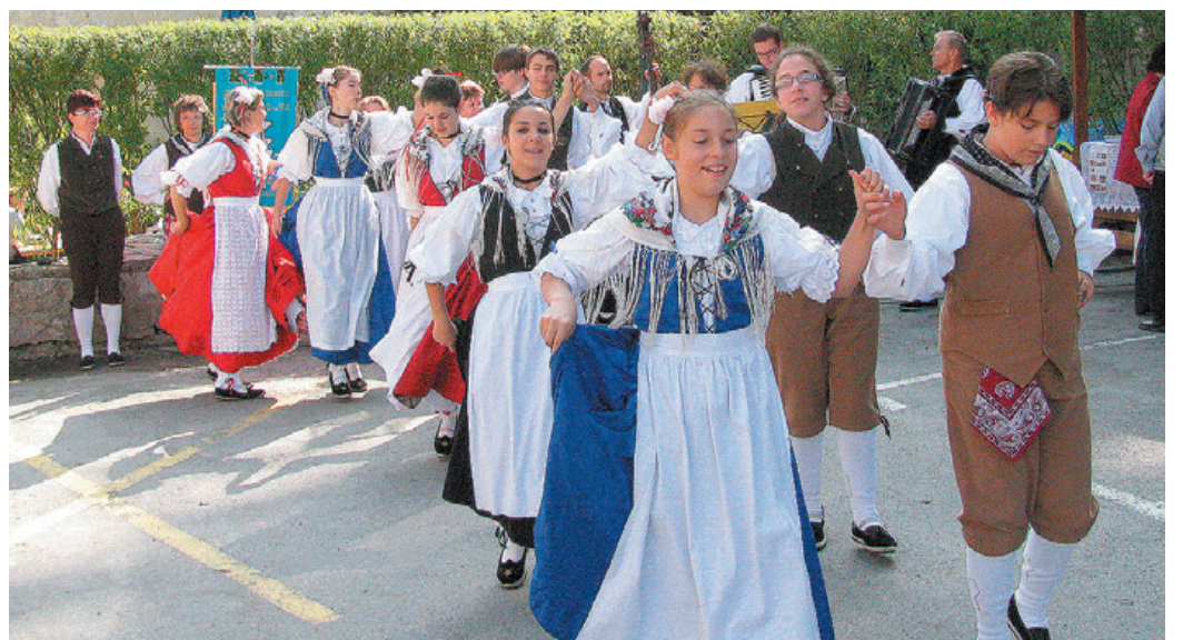
Na odru pri kavarni Veronika so svoje tradicionalne plesne prikazali folkloristi iz Nimisa, okolice Vidma.