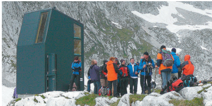
Pred novim zavetiščem po svečanem odprtju.