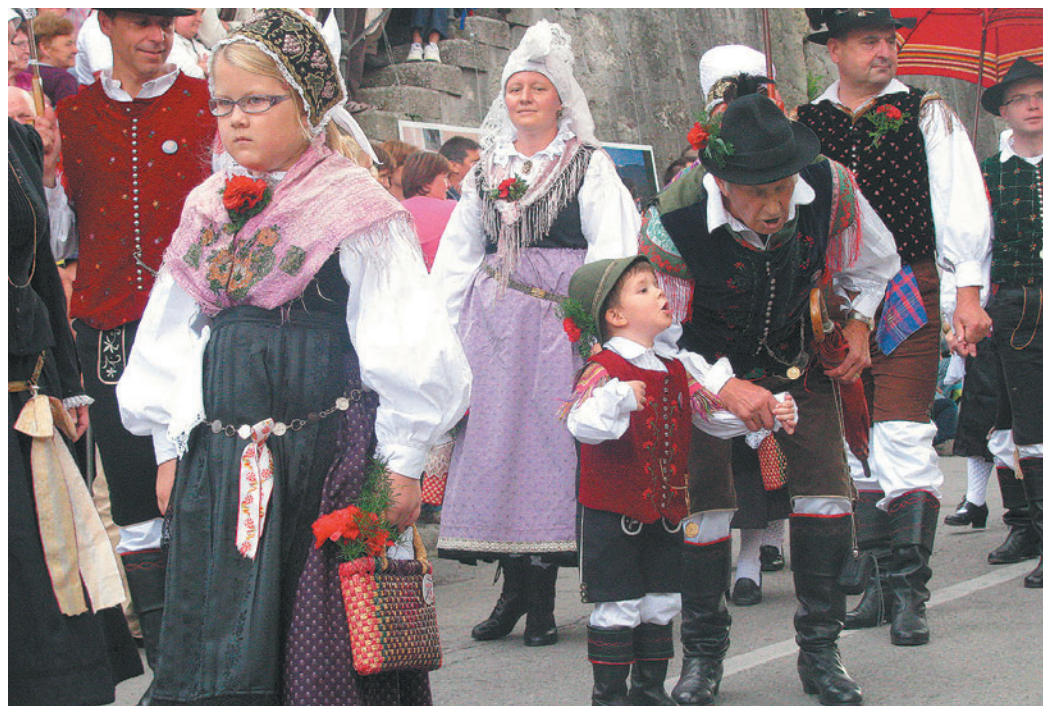
Vsako leto znova v povorki vse prisotne s svojo prikupnostjo očarajo najmlajši udeleženci. Gledalci so navdušeno pozdravljali malčka, ki je veselo 'zaukal' za svojim dedkom.