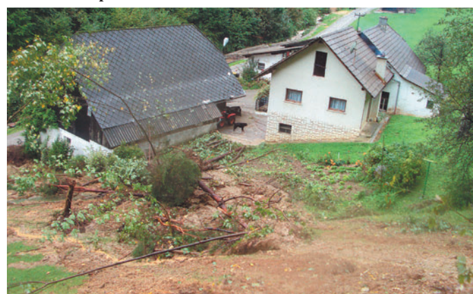
Obilno deževje je sprožilo zemeljski plaz v naselju Zajasovnik v krajevni skupnosti Motnik.