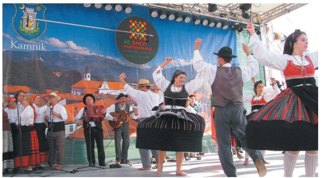
V nedeljo dopoldan se je na odru na Glavnem trgu predstavilo pet plesnih skupin iz Portugalske, Italije, Srbije in Makedonije. Portugalski so s svojimi barvitimi nošami, glasnim petjem ter tradicionalnimi instrumenti pripeljali v mesto mediteranski temperament, plesalci so bili sprva glasni v tradicionalnih coklah, še bolj pa, ko so se zavrteli bos.