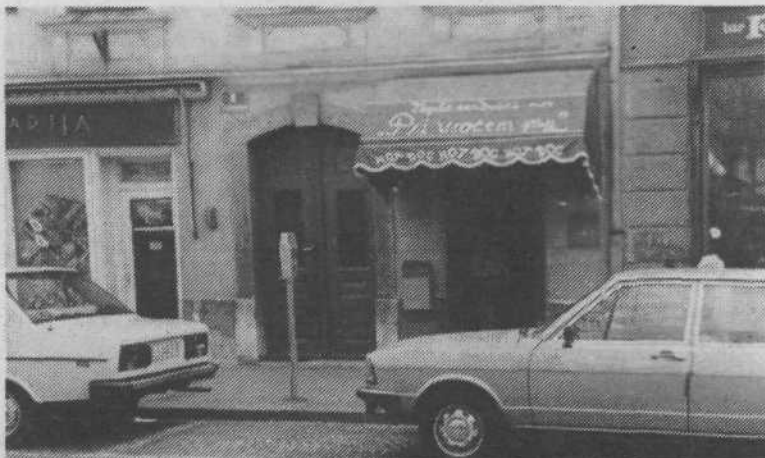
1. Okrepčevalnice, predvsem take manjše, kjer prodajajo tople sendviče po tuje tudi hot dog imenovane, po domače »vroči pes« v dobesednem prevodu, rastejo v Ljubljani kot gobe po dežju. Ena takih je »zrasla« med Platano in Lectarijo. Ob dopoldanski malici je treba na vročega psa čakati kar v vrsti.