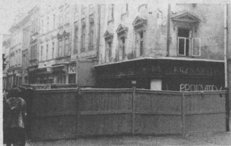
2. Končno se je le začelo. Obnova stare Ljubljane namreč. Eno najbolj razpadajočih hiš na Starem trgu so opasali s plotom in že začeli z notranjimi deli. Upajmo, da ta prva lastovka tudi dejansko pomeni novo pomlad tega dela Ljubljane.