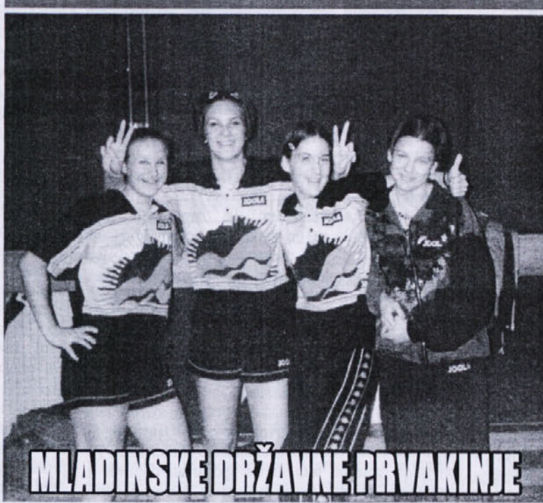
MLADINSKE DRŽAVNE PRVAKINJE