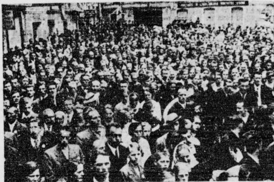
Del množice ljudstva med sveto mašo in zborovanjem na glavnem trgu na levi strani oltarja