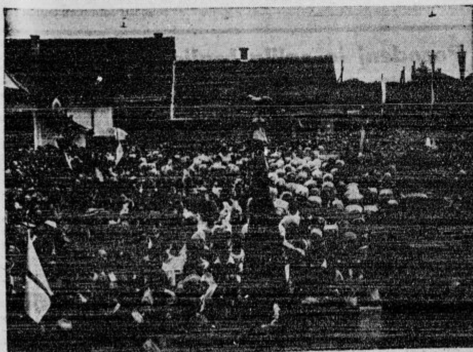
Ljubljanski župan, bote novega prosvetnega prapora gotori na taboru v Traovem.

d Navodila notranjega ministra o podpiranju gasilstva. Gasilskih društev v nekaterih banovinah sploh še ni. Zato je na podlagi vloge ministra za telesno vzgojo ljudstva notranji minister dr. Korošec odredil sledeče: 1. da skličejo okrajni načelniki s predsedniki občinskih uprav več sestankov, le-ti pa z občani vseh stanov v svrhu ustanovitve gasilskih organizacij v nji-