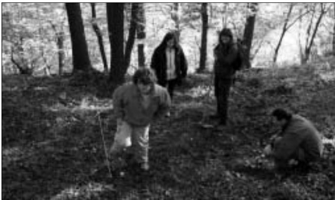
Del terenske ekipe ob začetku izkopavanj v sondi I. (16. 10. 2007)