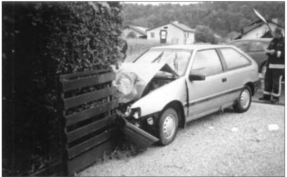
Nesreče na Mengeški cesti so vse pogostejše. Prizor že druge nesreče pred hišo Mesarjevih.

Kaj ovira že večkrat (vsaj s strani občine) obljubljen začetek posodabljanja ceste oz. urejanja pločnikov ob Mengeški cesti?