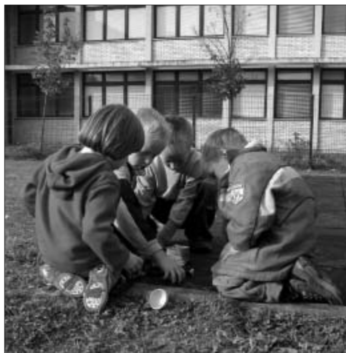
Kadar staknejo skupaj glave naši najmlajši, se ni bati slabega vremena.

Sprejetje nesončnega vremena kot nekaj pogostega in neobremenujočega je zelo pomembno pri vsakdanjem življenju. Zato je treba na plano tudi v dežju, megli in snegu - pač z dežnikom v roki in pelerino ali nepremočljivo jakno s kapuco na sebi. Staro pravilo je - odpravi se tja, kjer boš še lahko hodil z odprtim dežnikom, sicer lahko nastopijo ob močnejših padavinah ali v primeru neviht težave, zaradi katerih ne bomo le premočeni! Če bomo naravo doživljali v vsakem vremenu, bomo kmalu ugotovili, da slabega vremena pravzaprav ni. Tako nekako se je godilo tudi v letošnjem, vremensko sorazmerno mirnem oktobru. Rekordno toplih prvih osem mesecev letošnjega leta je marsikje omogočilo jesensko košnjo. Morda smo imeli že kdaj tako toplo, a v zadnjem stoletju in pol, odkar imamo na voljo vremenske podatke za naše kraje, zagotovo ne! Pridelali smo nekaj več dežja kot pri sosedovih (glej preglednico) in kot jih dobimo v povprečju, največ moče pa je bilo v začetku meseca. Natančneje 5. in 6. oktobra, ko je padla skoraj polovica (64 litrov) mesečnih padavin. Imeli smo 12 padavinskih dni (enkrat je tudi grmelo), ob jasnih