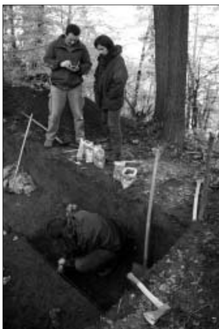
Čiščenje notranjosti prazgodovinske hiše - na profilu velike vrečke s številnimi najdbami kamnitih odbitkov, keramičnih črepinj in lepa (hišnega ometa).

zemlje našli tudi ogromno koščkov drobnega keramičnega materiala. Gre pravzaprav za manjše koščke lončenih črepinj, velikih le 1x1 ali največ 2x2 cm. Tik nad sterilno podlago pa so naleteli na ostanek t.i. školjke, to je okrogle luknje oziroma vkopa za leseni steber, ki je nekoč verjetno nosil zidno ali strešno konstrukcijo prazgodovinskega bivališča. Ko so kopali naprej, so na-