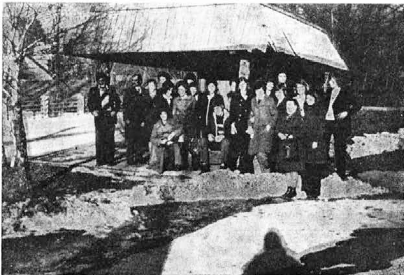
Mladi v Radovljici

Povsod beremo mnogo o tem, da je potrebno izobraževanju delavcev dati večji poudarek, a v praksi se to nikamor ne premakne.