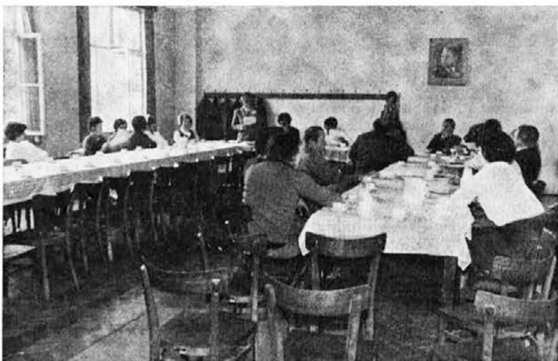
Člani CDS so že prvič obravnavali precej vprašanj

In kako bo z obdaritvijo žena za osmi marec? To bomo lahko videli šele po zaključnem računu za leto 1973.