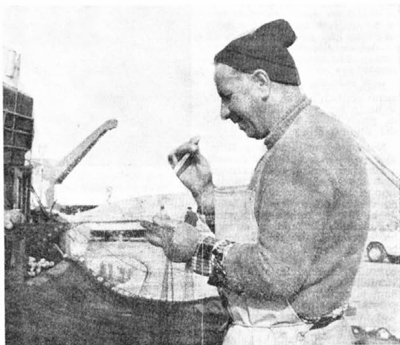
Pozimi namesto ribolova, krpanje mreže