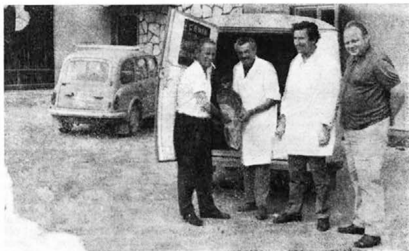
Dobro blago se samo hvali

Na vprašanja nam odgovorov niso poslali komercialni direktor, vodja prodaje na domačem trgu in vodja prodaje sveže ribe.