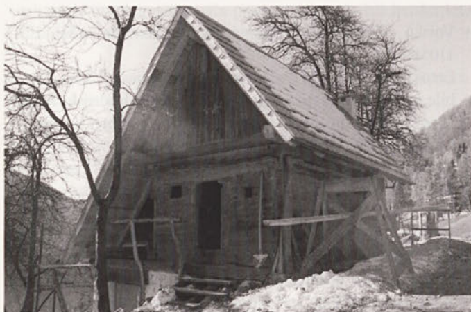
Kneške Ravne, lesena kašča na zidani osnovi. Popotresna obnova in konservatorske akcije. Foto: Andrejka Ščukovt, 2003

Na podlagi uspešne obnove kašče na Podobnikovi domačiji na Vojskem, ki leži v krajinskem parku Zgornja Idrija, sem za Idrijske razglede pripravila članek Obnovljena Zaklavžarjeva kašča. V časopisu občine Kanal - Most sem objavila članek Ipavčeva hiša v Dobljarju, rezultate terenskega dela oz. popisa lesenih kašč v Posočju pa v Primorskih srečanjih. V Varstvu spomenikov št. 40 je bil objavljen še članek Popotresna obnova nekdanje kaplanije v Kobaridu.