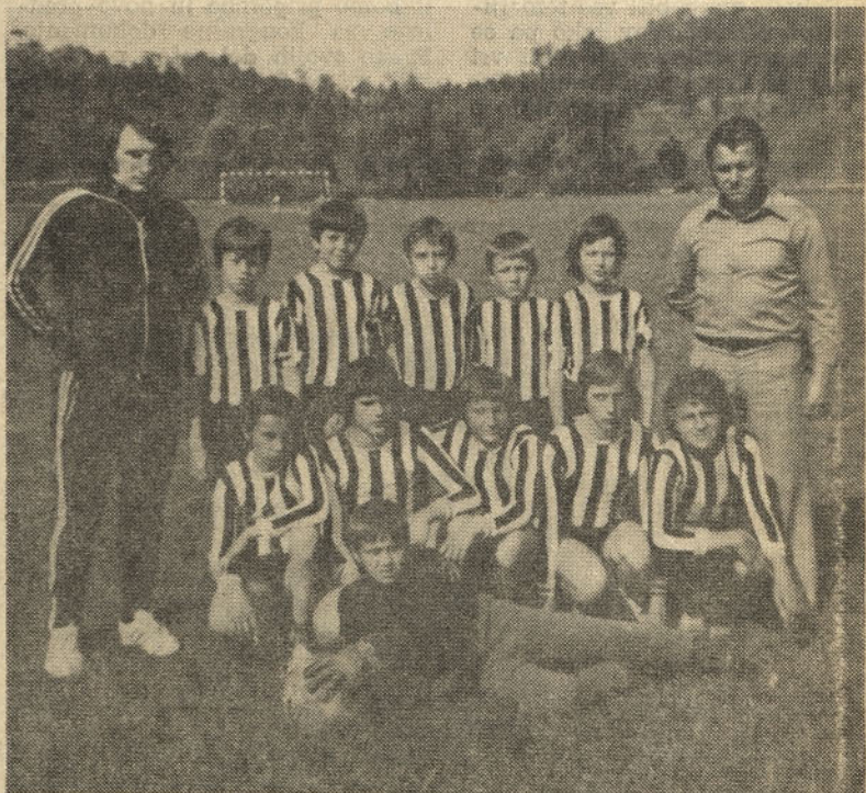
Pionirji s trenerjema

Želimo jim, da bi se jim želje res izpolnile.