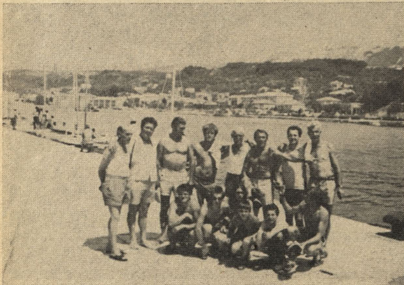
Dopustniška z Raba

Vse priprave na kongres pa potekajo tudi v aktivu ZM Železarne Štore. Imenovali smo posebno komisijo, ki bo podala razlago statuta in resolucije Zveze socialistične mladine Jugoslavije. Zbrali bomo pripombe in nove predloge za kongresne dokumente. Preko svojih delegatov pa bomo tudi mi od 2. do 4. oktobra sodelovali na kongresu.