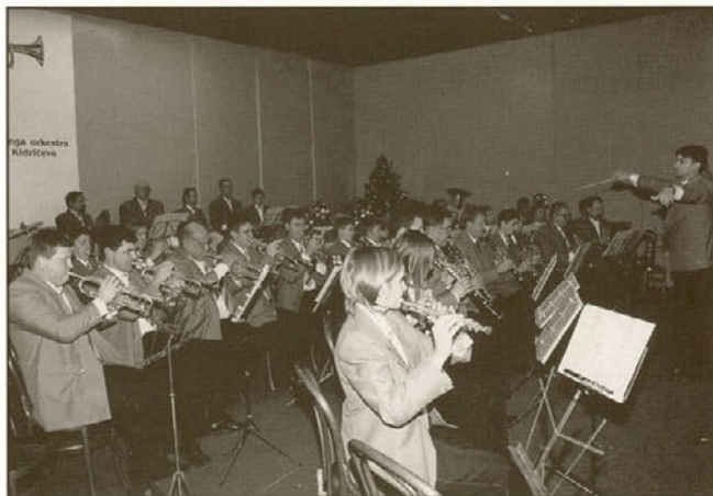
Pihalni orkester TALUM iz Kidričevega na enem od svojih nastopov.

MLADI DOPISNIKI • MLADI DOPISNIKI • MLADI DOPISNIKI • MLADI DOPISNIKI