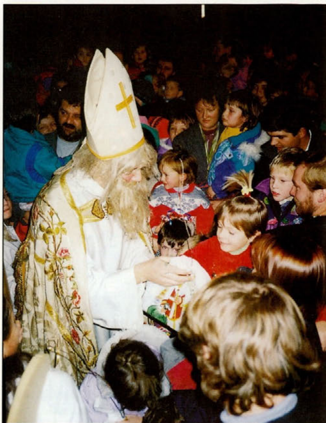
Tudi letos je Miklavž obdaril več kot 200 otrok naše občine.

Vsem občanom in bralcem časopisa »DOBRE MARNJE« sporočamo, da lahko oddajo članke za naslednjo številko časopisa na občinskem uradu Občine Majšperk do 20. februarja 1999.