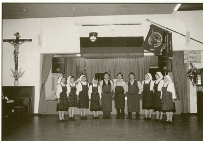
Marsikatero grenko solzo je utrnila pesem Ljudskih pevcev in pevk iz Stoperce "Daleč, daleč v kraju tujem, o sonati premišljujem".