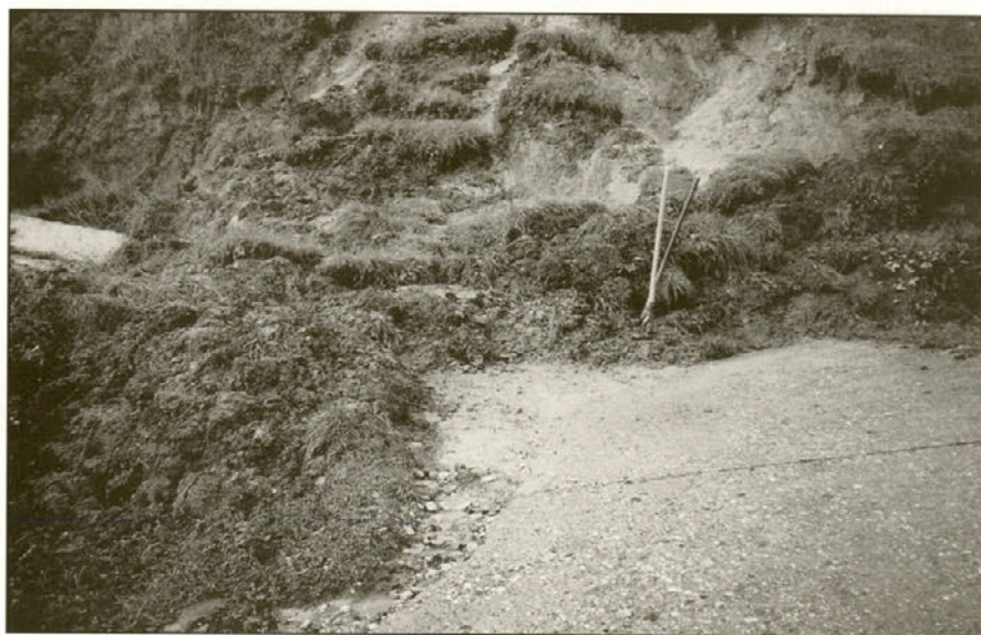
Zemeljski plaz je zasul cesto.

Nadaljnja sanacija nastale škode je odvisna od sredstev državne pomoči v naslednjem letu.