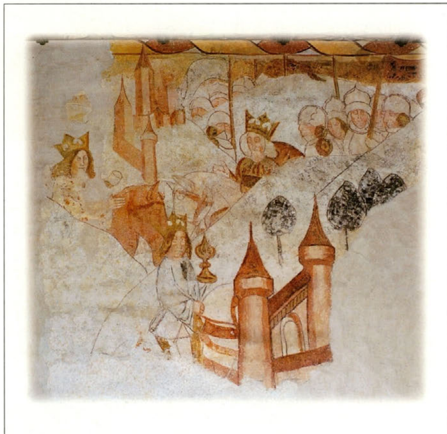
Pohod Svetih treh kraljev — delo je freska neznanega avtorja iz konca 14. stoletja. Podružna cerkev Sv. Bolfenka v Halozah — Majšperk. Restavrirano 1998.

Bliža se noč, čarobnih sanj, bliža se noč, vseh darovanj, bliža se noč ljubezni, želja, trkni s kozarcem, spij ga do dna.