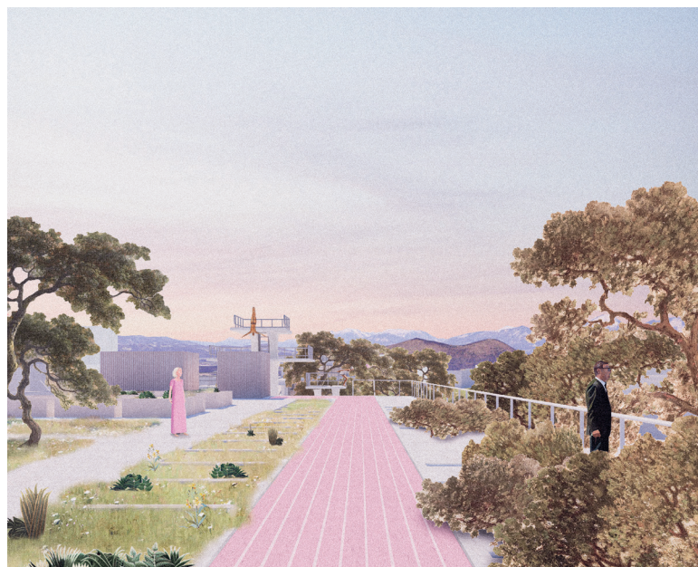
Vizualizaciji: Anja Mencinger