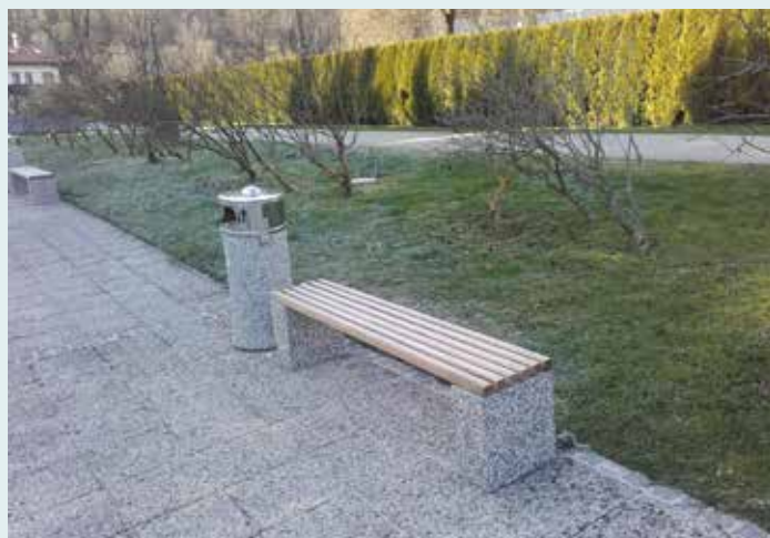
Kupljene so bile nove klopi in koši za smeti na platuju pred poslovnim objektom