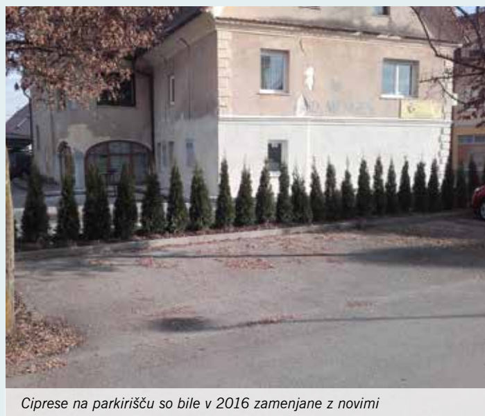
Ciprese na parkirišču so bile v 2016 zamenjane z novimi