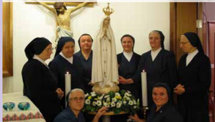
Sestre usmiljenke ob sprejemu Marije Romarice v sestrski kapeli 16. oktobra 2016

Našo Družbo hčera krščanske ljubezni je ustanoviteljica sv. Ludovika de Marillac že od samih začetkov posvetila Božji Materi Mariji. Izročitev Družbe Njej je nebeška Mati sprejela resno; in da nas ima za svoje, nam potrjuje na različne načine. Taki znamenji sta zagotovo tudi njena dva obiska naše skupnosti v podobi fatimskega kipa. Prvi obisk bi si pred tem še upala pričakovati, drugega pa nikakor. Nismo slutile, da bomo imele milost, da pride fatimska Marija Romarica k nam še tik pred vrnitvijo v Fatimo.