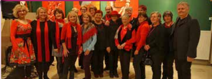
Skupinska fotografija razstavljalcev, mentorja in glasbenikov na odprtju razstave "Rdeča"