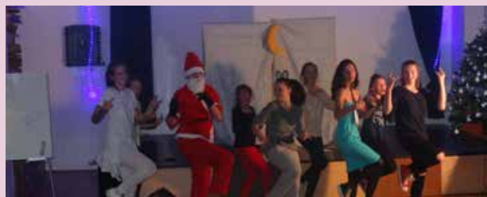
Mladinke Yes team-a so zaplesale v muzikalu Pet legend