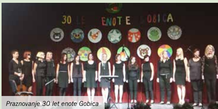
Praznovanje 30 let enote Gobica

Šolsko leto 2016/2017 smo pričeli zelo delovno. Pripravili smo naše igralnice z novimi dekoracijami, na novo smo opremili dve igralnici v enoti Gobica in ter ustvarili prijetno okolje za vse pričakovane otroke. Vrata smo odprli 400 otrokom, ki so vedoželjno stopili v vrtčevske prostore. Tako je prišel čas uvajalnega obdobja. Nekateri so z novimi začetki potočili kakšno solzico, večina otrok pa je z veseljem in novimi pričakovanji vstopila skozi vrtčevska vrata.