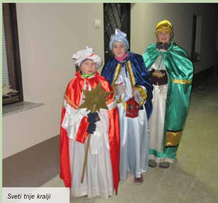
Sveti trije kralji