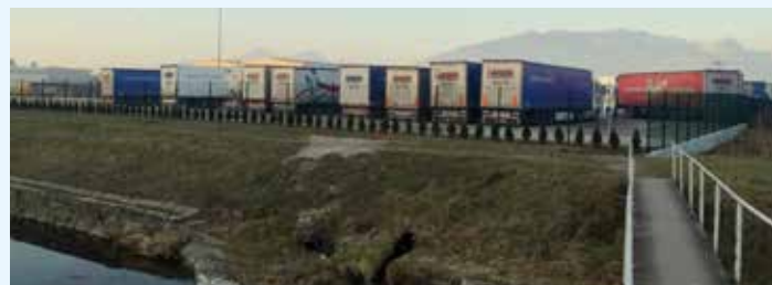
Topolska jama - nastajajoči »črni« raj za tovornjake?