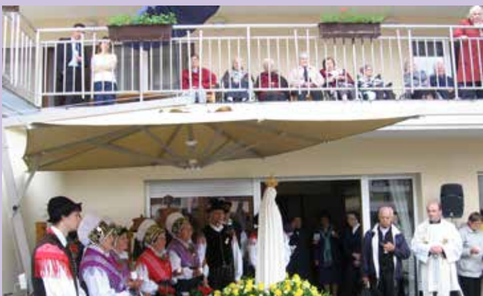
Sprejem Marije Romarice pred Domom sv. Katarine 13. maja 2016.