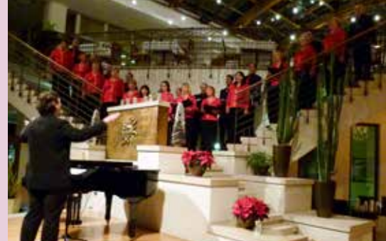
MePZ Svoboda - koncert v Portorožu