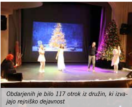
Obdarjenih je bilo 117 otrok iz družin, ki izvajajo rejniško dejavnost

Ob 17. uri je v ponedeljek, 5. decembra 2016 v Domžalah, v Kulturnem domu Franca Bernika potekala Miklavževa obdaritev otrok iz družin, ki izvajajo rejniško dejavnost.