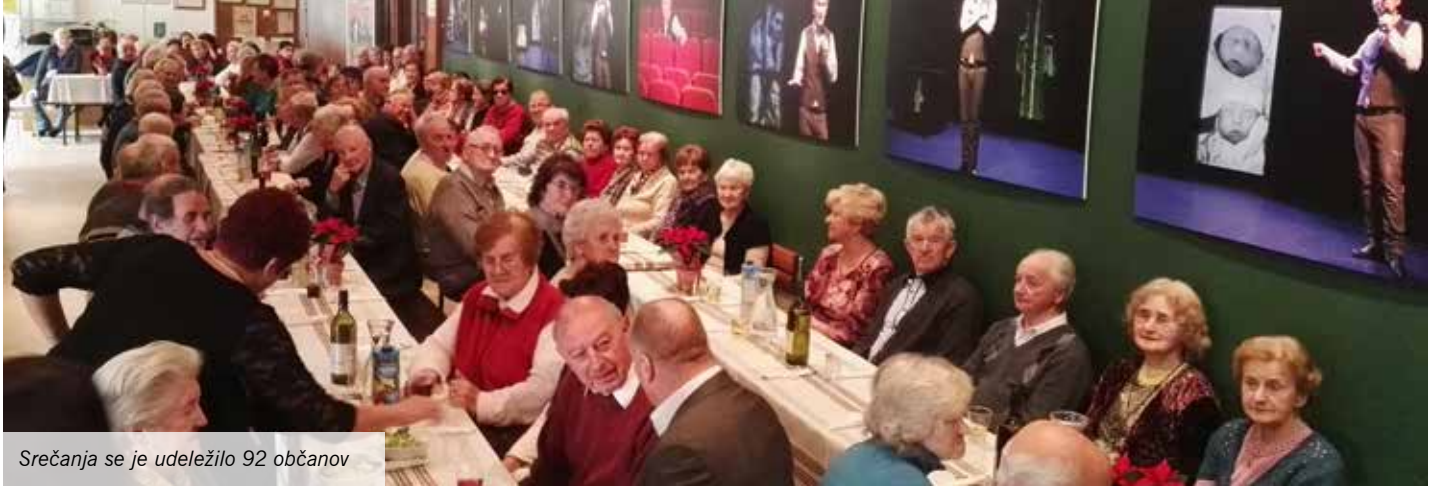
Srečanja se je udeležilo 92 občanov