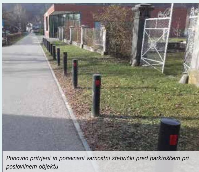
Ponovno pritrjeni in poravnani varnostni stebrički pred parkiriščem pri poslovnem objektu