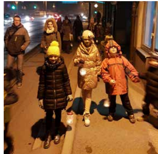
Otroci z lanternami, ki so jih izdelali sami