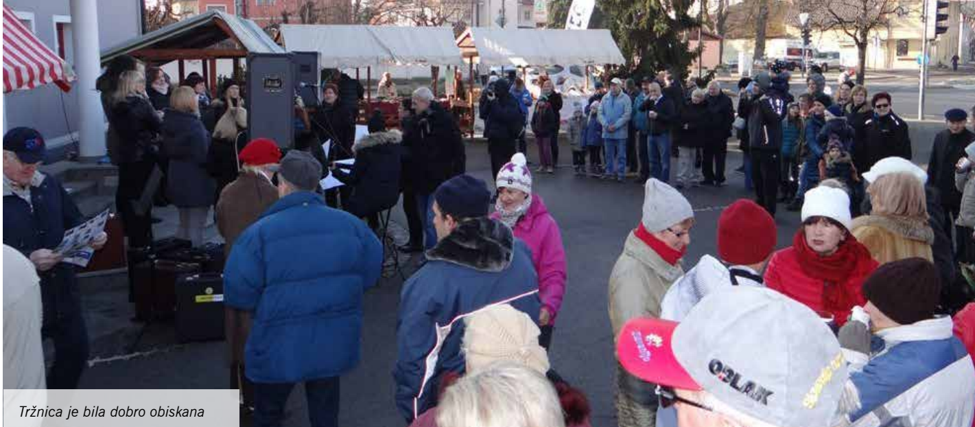
Tržnica je bila dobro obiskana