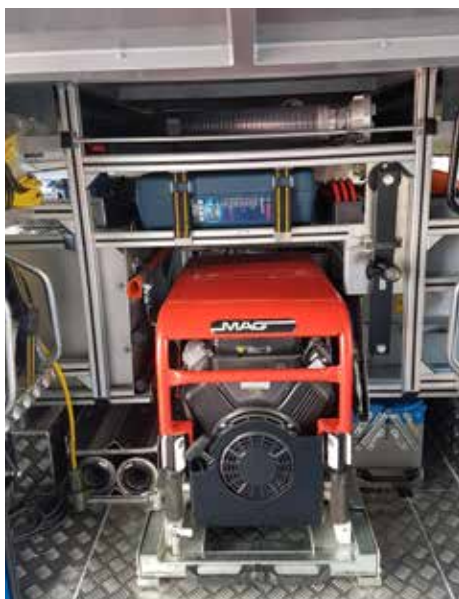
Vsebovan električni agregat moči 11 KW z opremo za razsvetljavo