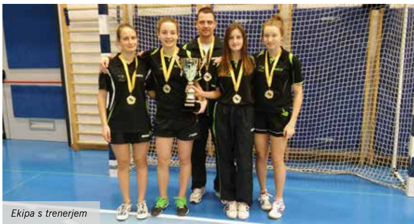
Ekipa s trenerjem