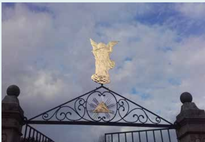
Okrasje nad vrati je bilo restavrirano, saj so bili simboli na njem komajda vidni

Javno komunalno podjetje Prodnik d. o. o. kot upravljavec pokopališča Mengeš skrbi za redno vzdrževanje, čiščenje in urejanje pokopališč.