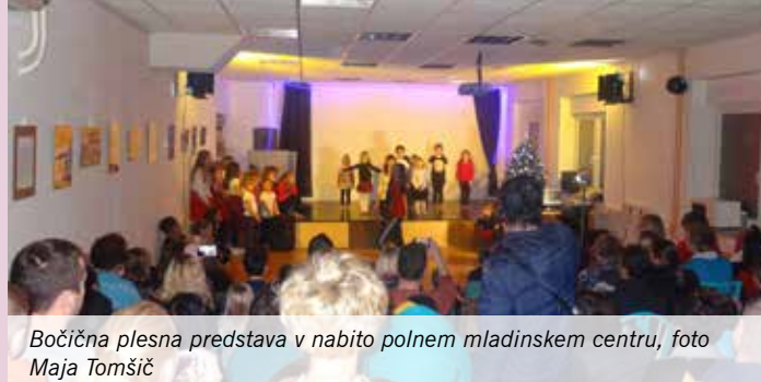
Božična plesna predstava v nabito polnem mladinskem centru, foto Maja Tomšič