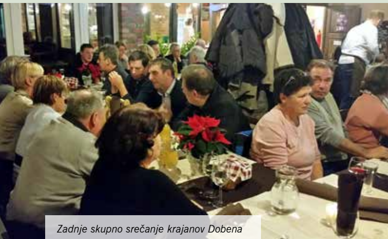
Zadnje skupno srečanje krajanov Dobena

Prednovoletni dnevi in večeri so tudi čas veselega druženja s tistimi, ki so nam blizu: prijatelji, znanci, sodelavci, sosedi, da skupaj, še enkrat v odhajajočem letu, dvignemo čašo, še malo poklepetamo o storjenem, zamujenem, kaj bi naredili drugače, kaj bomo še storili in zato, da si voščimo vse dobro!