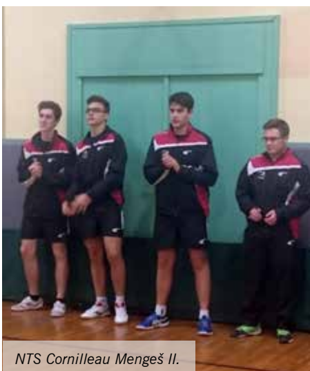
NTS Cornilleau Mengeš II.