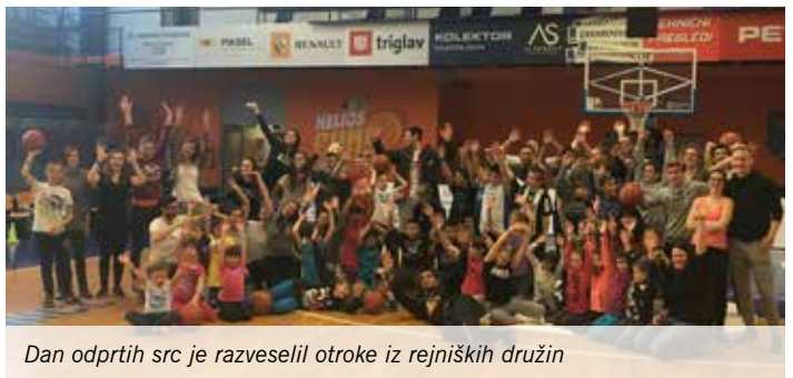
Dan odprtih src je razveselil otroke iz rejniških družin

Besedilo in foto: Marta Tomec, univ. dipl. soc. del.