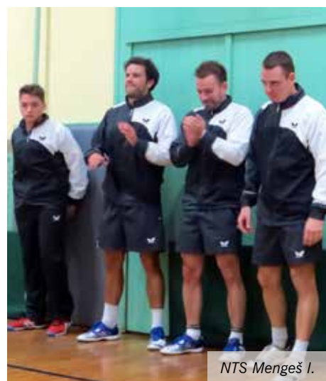
NTS Mengeš I.