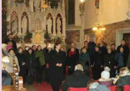
APZ Šutna in MePZ Svoboda Mengeš koncert v cerkvi Sv. Mihaela v Mengšu