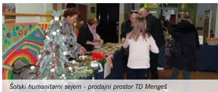
Šolski humanitarni sejem - prodajni prostor TD Mengeš