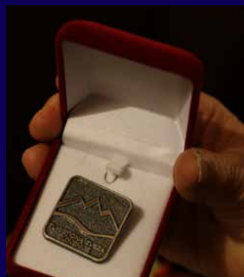
Srebrni znak Turistične zveze Slovenije