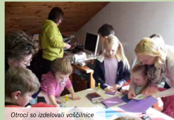
Otroci so izdelovali voščilnice