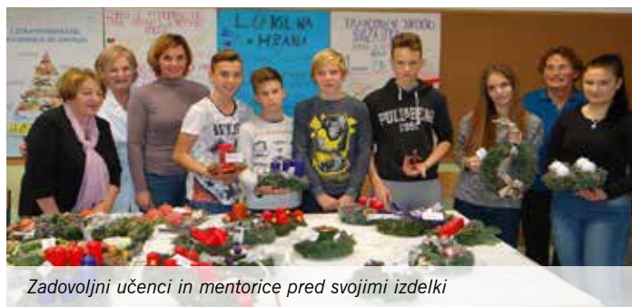
Zadovoljni učenci in mentorice pred svojimi izdelki