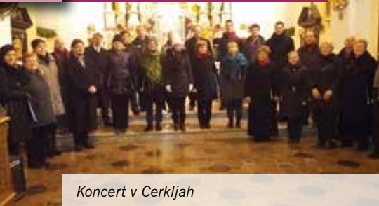
Koncert v Cerkljah