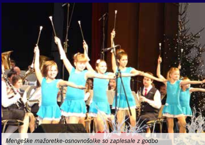
Mengeške mažoretke-osnovnošolke so zaplesale z godbo