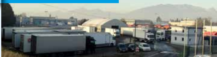
»Črno« parkirišče ob Pšati se polni s tovornjaki. Dovoljenja? Niso potrebna!

glasbe ali bo mesto ropota, smradu in nezdravega življenja??? Ukrepati je treba, dokler je še čas.