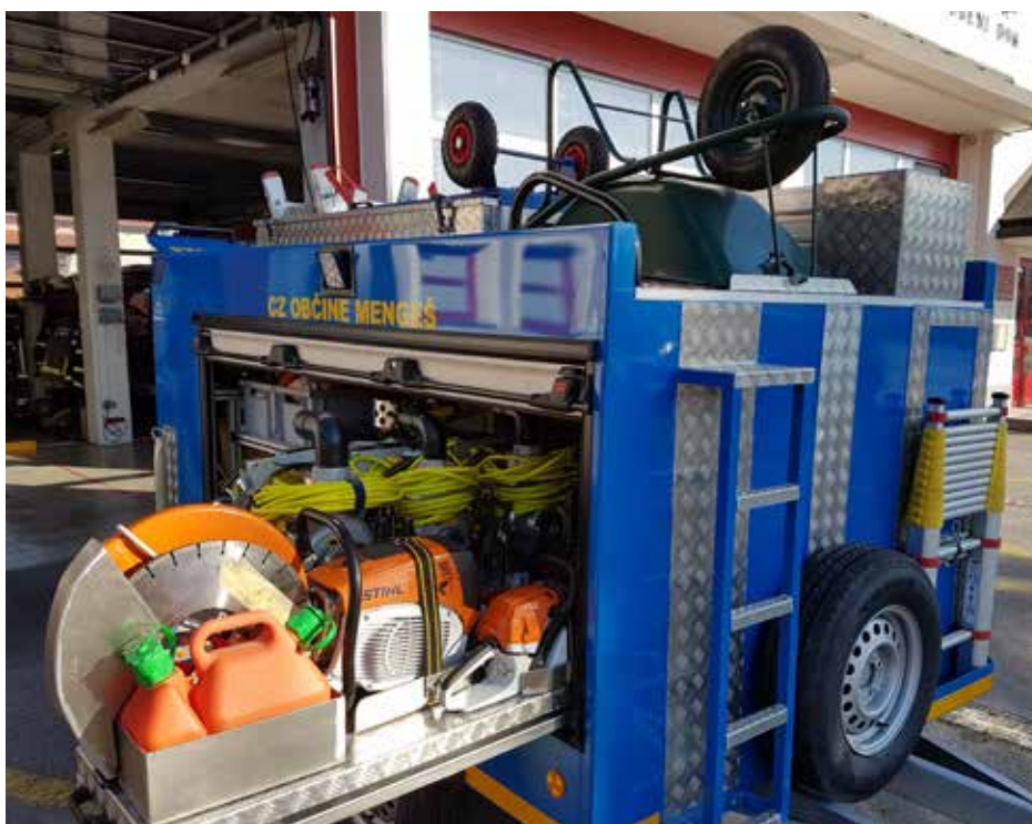
Priklopnik je namenjen za posredovanje ob poplavih, ob morebitnem rušenju zgradb, žledu, neurjih