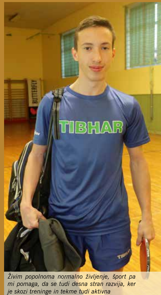
Živim popolnoma normalno življenje, šport pa mi pomaga, da se tudi desna stran razvija, ker je skozi treninge in tekme tudi aktivna