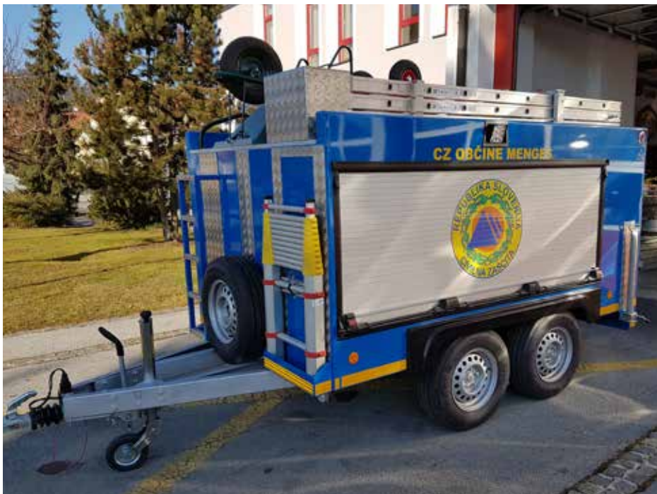
Namensko izdelan večnamenski priklopnik

Besedilo in foto: Janez A., Štab CZ Občine Mengeš