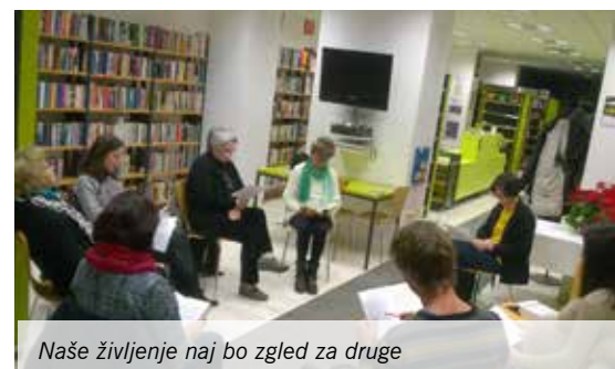
Naše življenje naj bo zgled za druge

Besedilo: Dragica Rutar