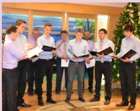
Božične pesmi so razveselile oskrbovance