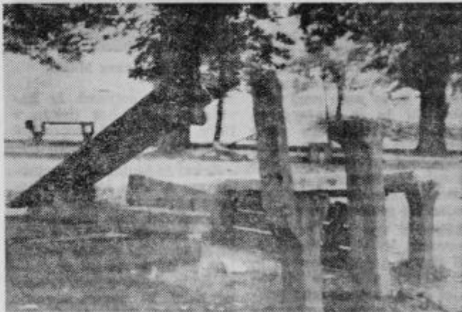
Polomljene klopi in mize v ptujskem parku

izsledil storilca. Povedal je še eno pikro na račun ptujskih huliganov. Neko nedeljo zjutraj pred nedavnim je na sprehožu skozi park opazil na vsaki mizi kup človeških