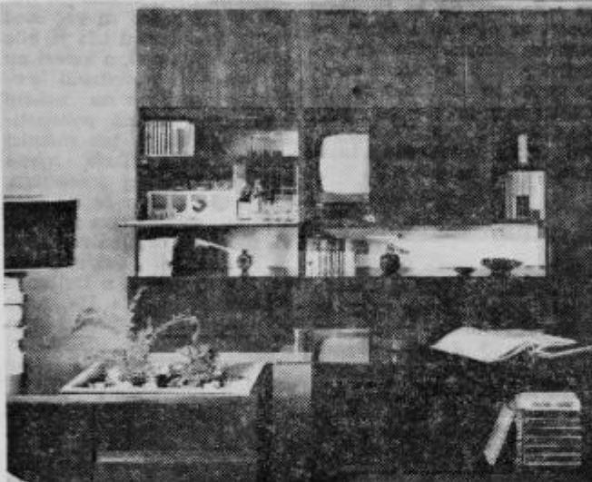
Dnevna soba »Daniela«

povedala, da se bo ob nakupu odločila za švedsko kuhinjo. Je lepša. Zdi se, da bo v njej boljše kuhala. Na razstavi je vse lepo. Cene so nekoliko visoke, a je v stanovanju s takim pohištvom res lepo.