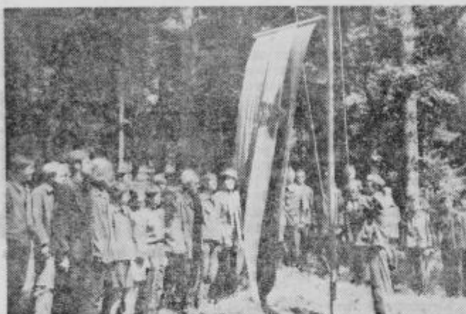
Mladinska brigada v Ljudskem vrtu ob dviganju zastave