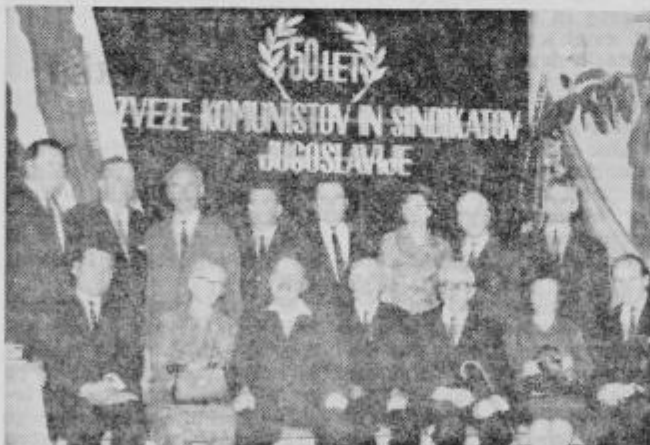
Prejeli so odlikovanja predsednika Tita