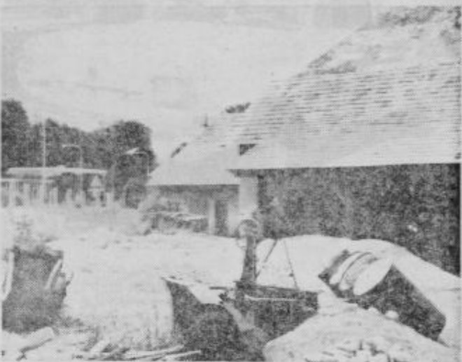
Skrajno zanemarjen prostor ob mestni vpadnici nasproti bencinski črpalki.

Pri tem človek nehote pomisli na ponudbe velikih trgovskih hiš, ki se že dolga leta borijo za lokacijo za gradnjo trgovskih poslopij v Ptuj. Zakaj jim ne prodamo tega in podobnih prostorov? Sedizali bi večje trgovske lokale, uredili okolico, mesto pa bi postalo trgovsko središče. Poleg tega, da bi imeli ob vpadnicah red in čistočo, ptujskim in okoliškim potrošnikom ne bi bilo več treba kupovati v Mariboru stvari, ki jih ptujске trgovine nimajo, ali le redkokdaj dobijo. —b