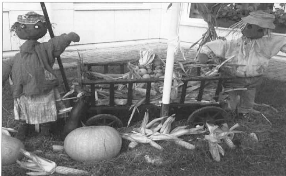
Ko je v deželo prišla jesen, so jo v Domu starejših Na Fari na Prevaljah takole pozdravili.

Rešitve: 1. volk, SIMON JENKO 2. gad, JANEZ CIGLER 3. pes, JOSIP STRITAR 4. ovca, ALOJZ STRITAR 5. srna, IVAN PREGELJ 6. miška, CIRIL KOSMAC 7. mačka, IVAN POTRČ 8. pav, DRAGO JANČAR 9. gams, MIŠKO KRANJEC 10. osel, ANDREJ MOROVIČ