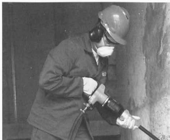
Delo z razbijalnim kladivom, izdelkom SŽ-Opreme Ravne