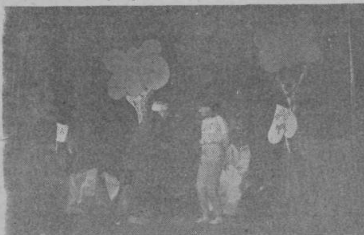
Dramska skupina OŠ Šmarje je navdušila z odlomkom iz igrice MEDVED PU IN NJEGOV PRIJATELJI.

Vse prireditve so bile dobro obiskane, kar dokazuje, da je šlo za dobro sodelovanje ZKO Grosuplje in šol v krajih, kjer so bile revije. Posebno pohvalna je udeležba nastopajočih s šol, saj so se revij udeležile domala vse šole v naši občini.