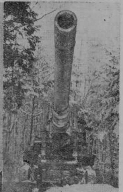
Žrelo nemškega topa na zahodnem bojišču. Topovi so namesčeni ter zakriti tako, da jih je zelo težko opaziti iz zraka