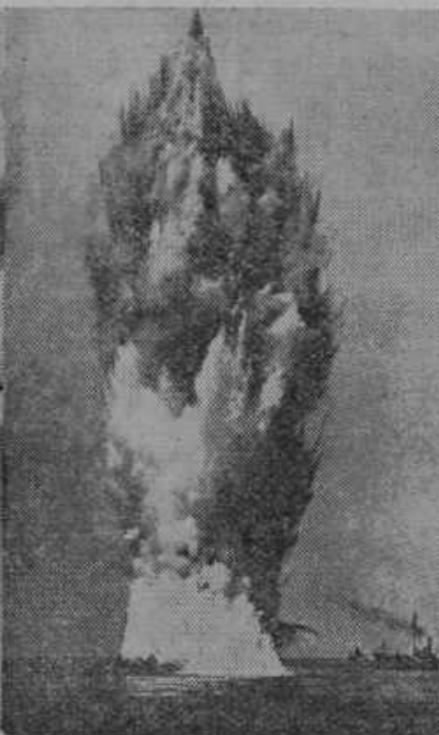
Mine igrajo v pomorski vojni zelo veliko vlogo. Slika nam predstavlja moment, ko taka mina eksplodira