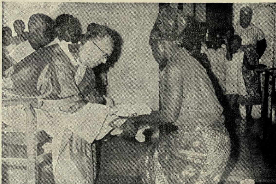
Prinašanje darov pri maši