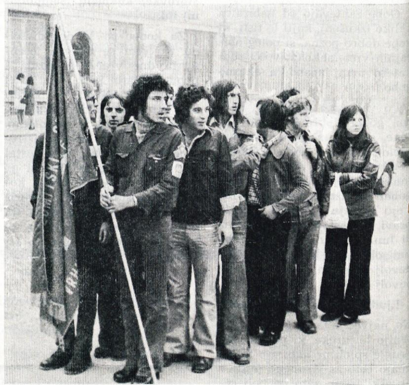
Pripravljani na odhod