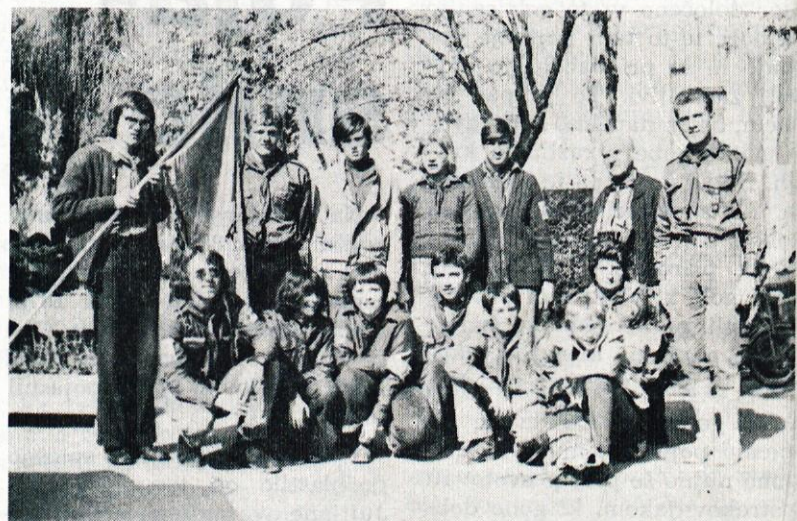
Z nami so bili tudi taborniki