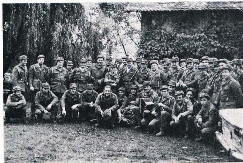
Borovniška partizanska enota po zaključku uspešno opravljene naloge