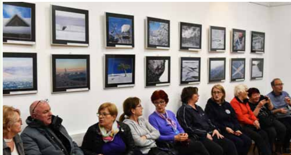
Zanimiva razstava bistrških fotografov

Dolgoletno sodelovanje Foto kluba (FK) Sušec iz Ilirske Bistrice in Slovenskega doma KPD Bazovica na Reki je prineslo novo prireditev. Ob dvajsetletnici delovanja teh bistrških fotografov je bila v klubski sobi društva odprta razstava fotografij z zimskimi motivi in devetindvajset posnetkov fotografskih mojstrov je tako prineslo vsaj malo zime na Reko. Obenem v KPD Bazovica upajo, da bo ta razstava ponovno spodbudila fotografe v društvu in oživila dejavnost fotografske