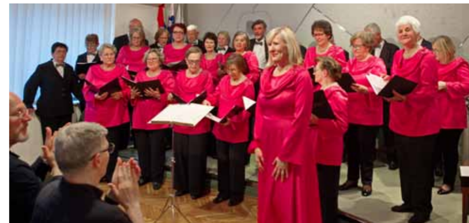
Nastop reškega društva razveselil občinstvo v Zagrebu

| Povzeto po zapisu www.slovinci-zagreb.hr