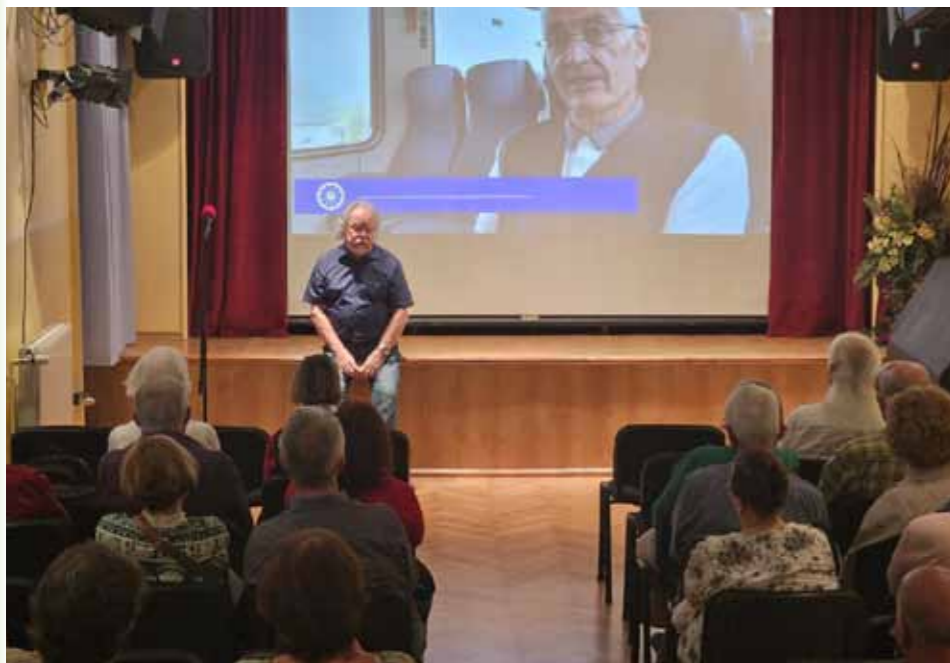
Pohvaljen večer o Reški progi, arhiv KPD Bazovica

V KPD Bazovica je bil na ogled dokumentarni igrani film Reška proga, posnet ob 150-letnici železniške proge Pivka–Reka na pobudo Društva ljubiteljev železnic iz Ilirske Bistrice. Premiérne predstavitve filma oktobra lani v Ilirski Bistrici so se udeležili tudi predstavniki KPD Bazovica, dogodek pa je omejen v decembrski številki Sopotij.