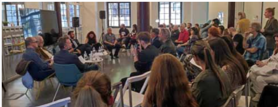
Med obiskovalci večinoma mladi, foto: www.documenta.hr

Različni pogledi na interpretacije zgodovine holokavsta, genocida in drugih vojnih zločinov iz časa druge svetovne vojne so bili tema prvega dogodka, ki je potekal v okviru dveletnega evropskega projekta z naslovom Moč osebnih zgodb v soočanju s pozabo (Power of Personal Stories in Confronting Oblivion – PPSCO). Projekt sofinancira EU v sklopu programa Državljeni, enakost, pravice in vrednote (Citizens, Equality, Rights and Values – CERV).