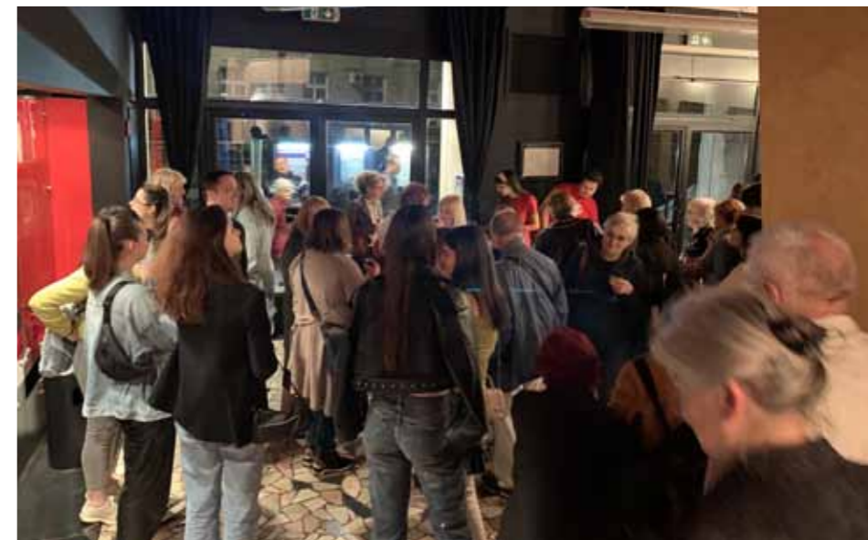
Po dobro obiskani predstavi