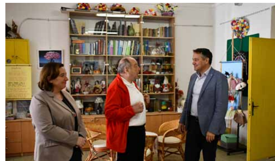
Z obiska v Lovranu