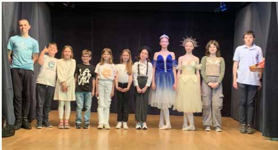
Nastopajoči na poklonu, foto: Marjana Mirković

V KPD Bazovica je potekala tretja prireditev z otroškim nastopom ob materinskem dnevu, neformalnem prazniku, ki izvira iz ZDA in se na Hrvaškem praznuje drugo nedeljo v mesecu maju, v Sloveniji pa 25. marca.