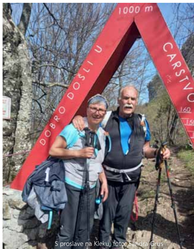
S proslave na Kleku