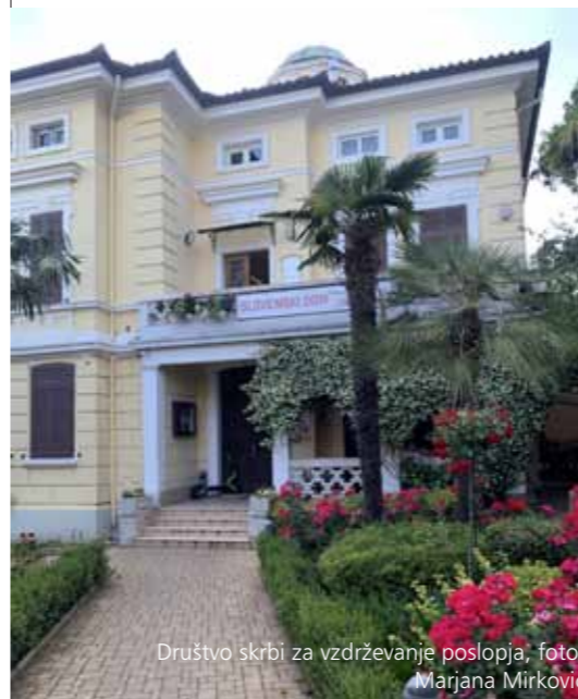
Društvo skrbi za vzdrževanje poslopja