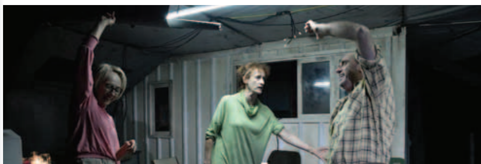
Prizor iz predstave