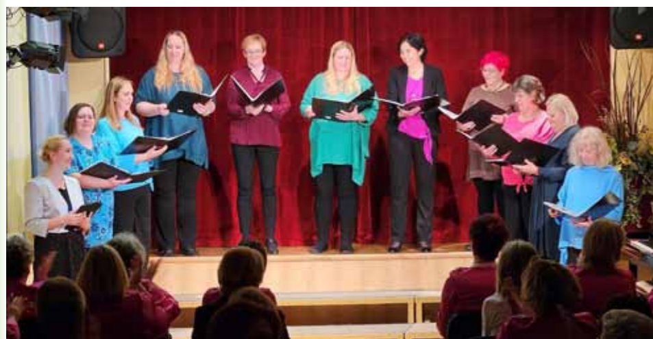
Lep pevski večer skupine Brinke, foto: arhiv KPD Bazovica

Na odru dvorane KPD Bazovica nas je po obisku pred desetletjem z nastopom znova razveselila pevska skupina Brinke z Grosupljega in skupaj z gostiteljem, mešanim pevskim zborom reškega slovenskega društva, obiskovalcem prinesla še en zelo lep pevski večer.