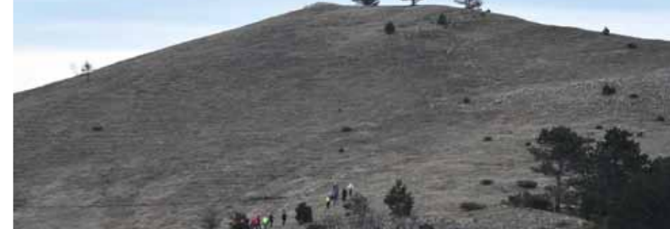
Lepa narava Čičarije