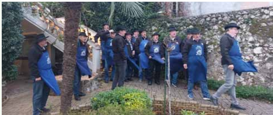
Malečniški pevci znova popestrili dogodek

23. februar, Slovenski dom KPD Bazovica Stara trta