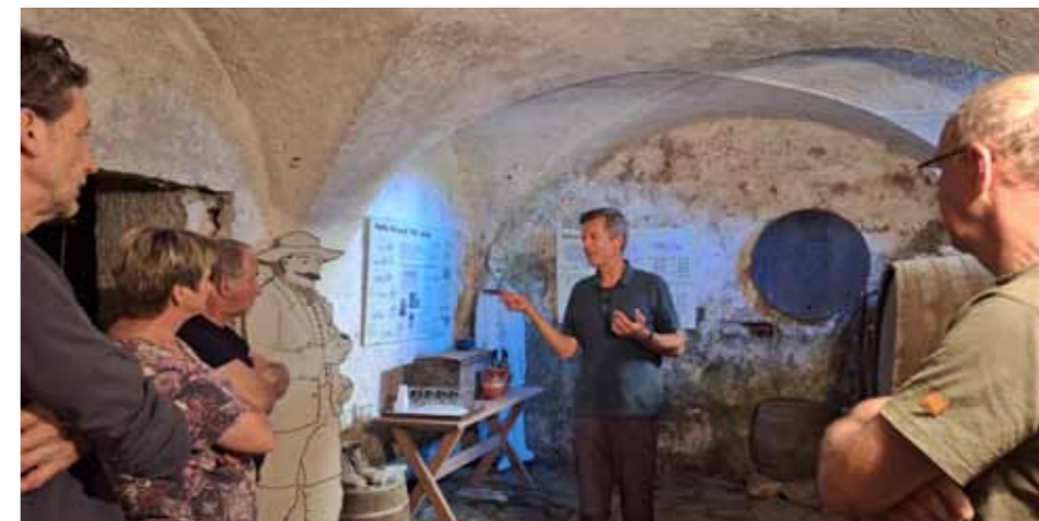
Obnovljena vinska klet znova obiskana, foto: Marko Smole