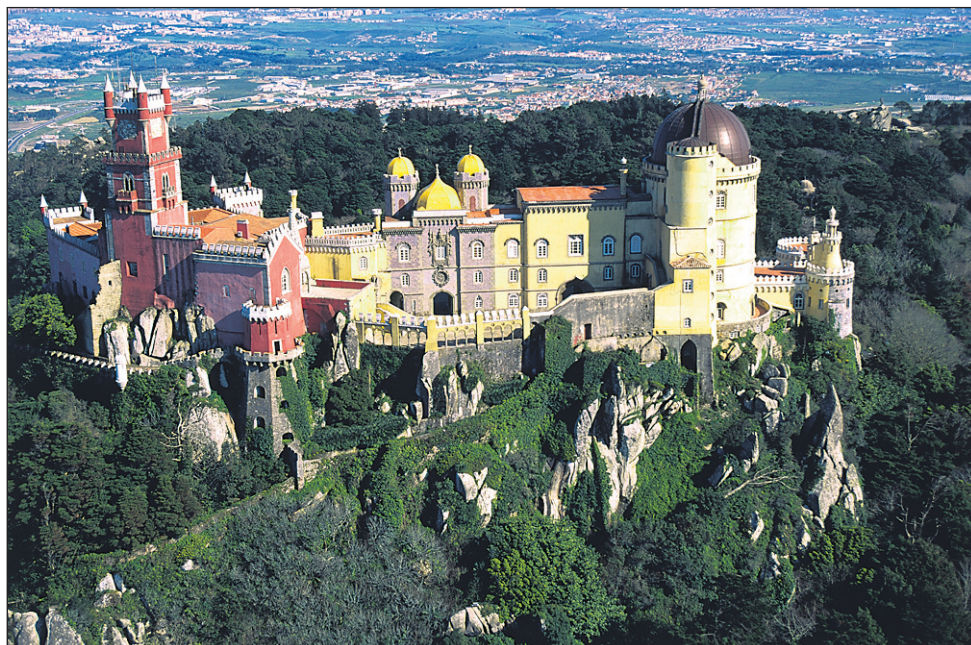
Ena izmed znamenitosti Portugalske je palača Pena v Sintri.