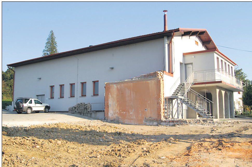
Novo občinsko poslopje bodo zgradili ob kulturni dvorani na Goričaku, kjer so zaradi tega že porušili poslopje nekdanje stare trgovine.