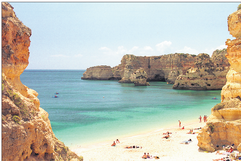
Portugalska se ponaša s prelepimi plažami.

Nekaj let je delala v oglaševanju, a ker je to delo ni izpopolnjevalo in se ji je zdelo preveč enolično, je poiskala novo. Poskusila se je v vlogi učiteljice računalništva, kar ji je, kot pravi, predstavljalo poseben užitek, saj je bila v nenehnem stiku z različnimi ljudmi. A ker je Lilia tip človeka, ki nenehno rabi nove izzive, se je po določenem času tudi tega dela naveličala. Pričela je iskati različne opcije, med njimi pa se je znašlo tudi prostovoljno delo preko organizacije EVS. »Tako se mi je zdelo zanimivo, saj sem tip človeka, ki so mu izkušnje zdijo veliko pomembnejše kot zaslužek,« je