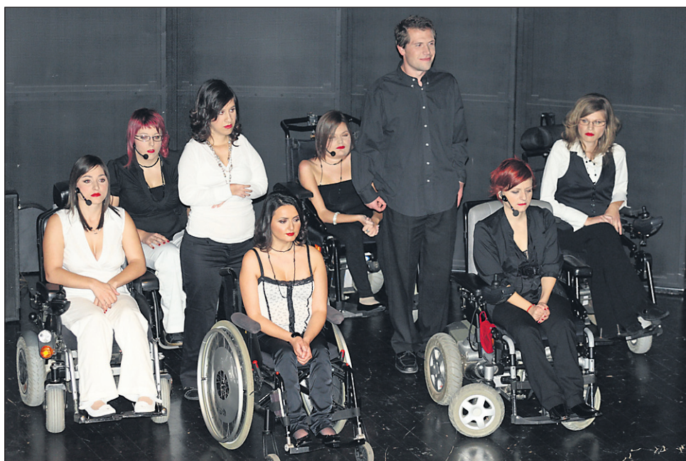
S komedijo Vse, kar ste želeli vedeti o nas, pa si niste upali vprašati so 20-letnico društva Sonček Ptuj obogatili člani društva študentov invalidov.