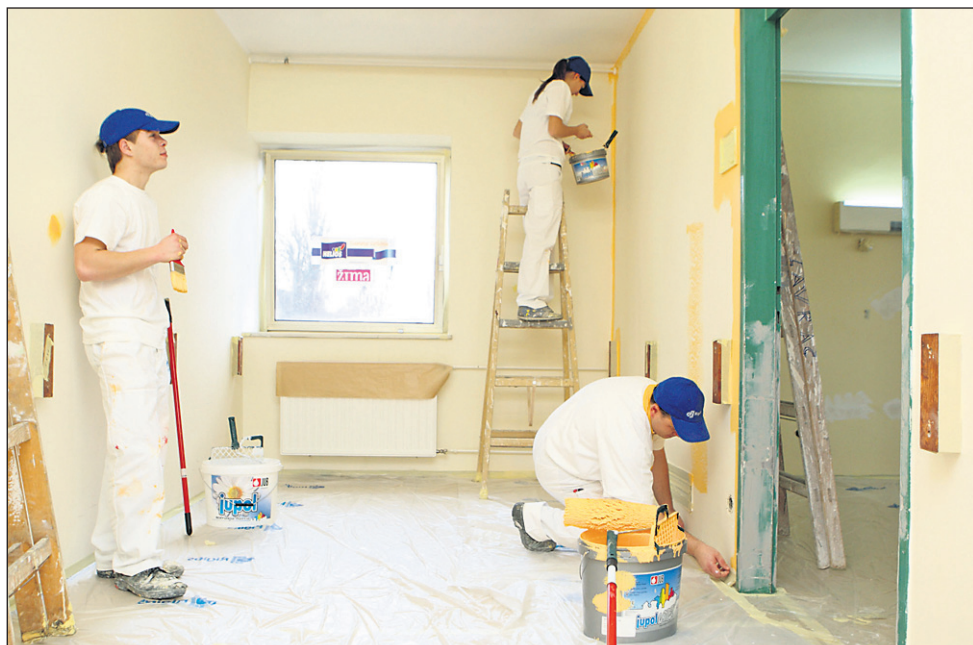
Blizu 70 slovenskih slikopleskarjev se je v tekmovalnem in humanitarnem delu nadvse izkazalo.