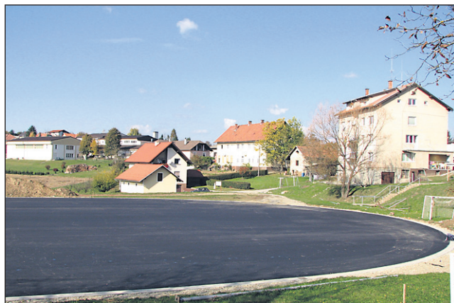
Igrišče so začeli urejati že letos, nadaljevali pa bodo v prihodnjem letu, ko naj bi zanj namenili še okrog 100.000 evrov.