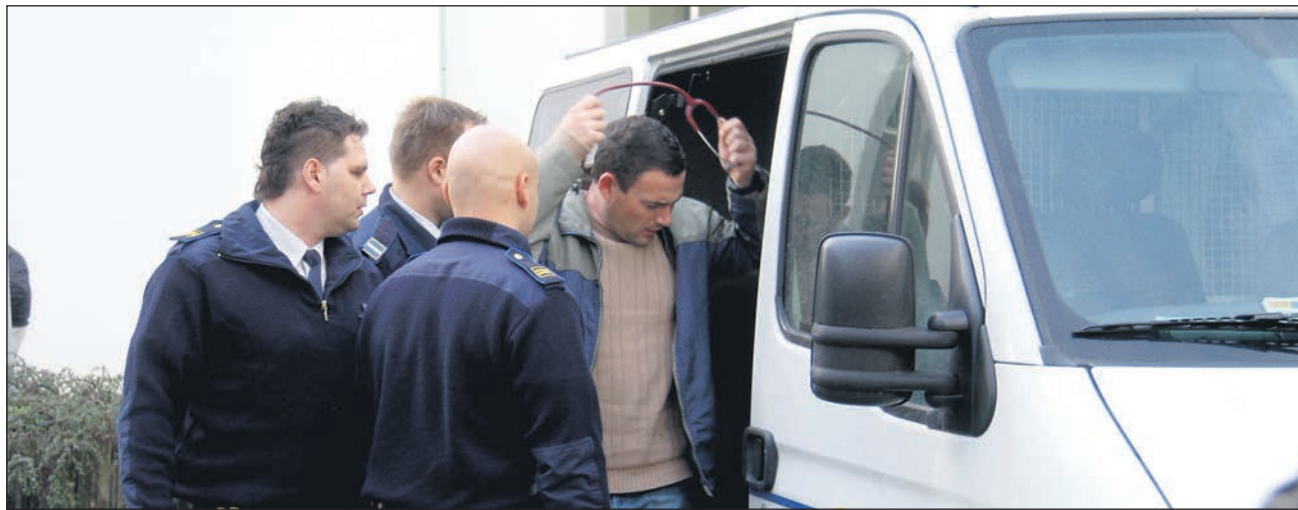
Na začudenje novinarjev je iz prostora za potnike oziroma zapornike prvi izstopil moški srednjih let s stetoskopom okoli vratu; kot smo neuradno izvedeli, naj bi šlo za zaporniškega zdravnika.

Sicer pa se je po Ptuj neuradno izvedelo, da naj bi na zadnjem nadaljevanju glavne obravnave, v ponedeljek, 23. novembra, prišlo do več poskusov obtoženega, da bi se zasliševanju izognil. Po nam dosegljivih podatkih naj bi med zasliševanjem obdolženi P. R. tožil, da naj bi mu bilo slabo. Po nekaterih govorica naj bi se v sodni dvorani celo