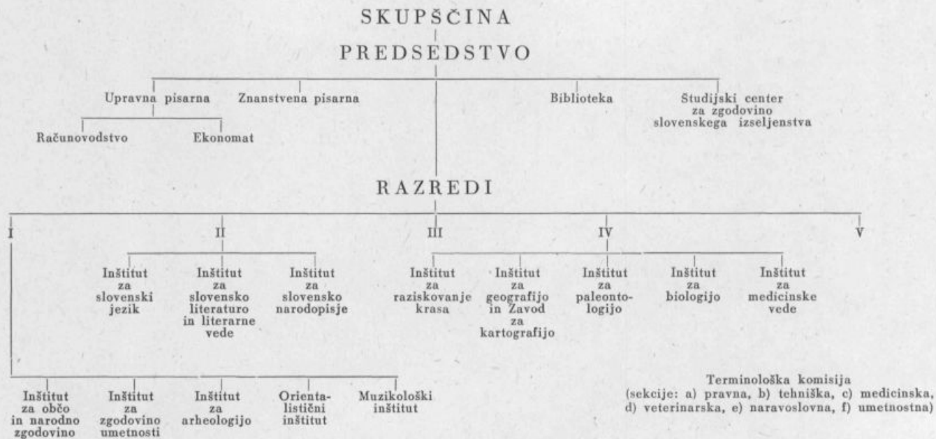
Preglednica organizacije Slovenske akademije znanosti in umetnosti