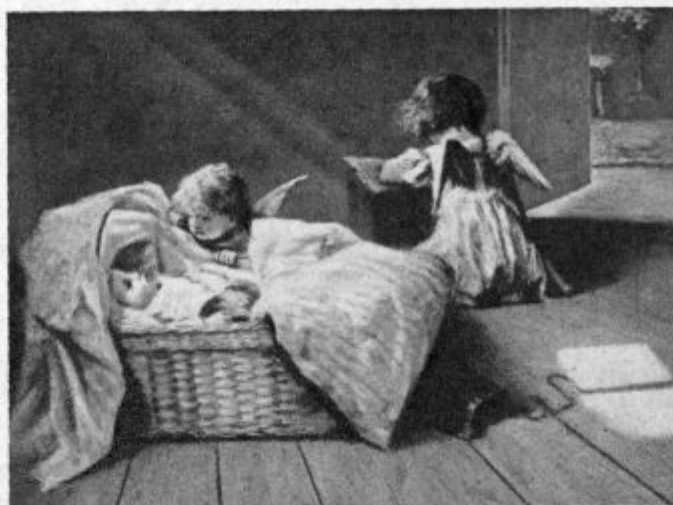
Angelci na obisku . . .

Kako so potekala leta Marijinega življenja v templju? Brez dvoma v molitvi in delu. Marija je prejela že ob svojem spočetju poseben dar globokega spoznanja božjih skrivnosti, dasi na zunaj po telesu ni bila še toliko razvita, da bi mogla to s svojim umom spoznavati. Ta dar je Bog