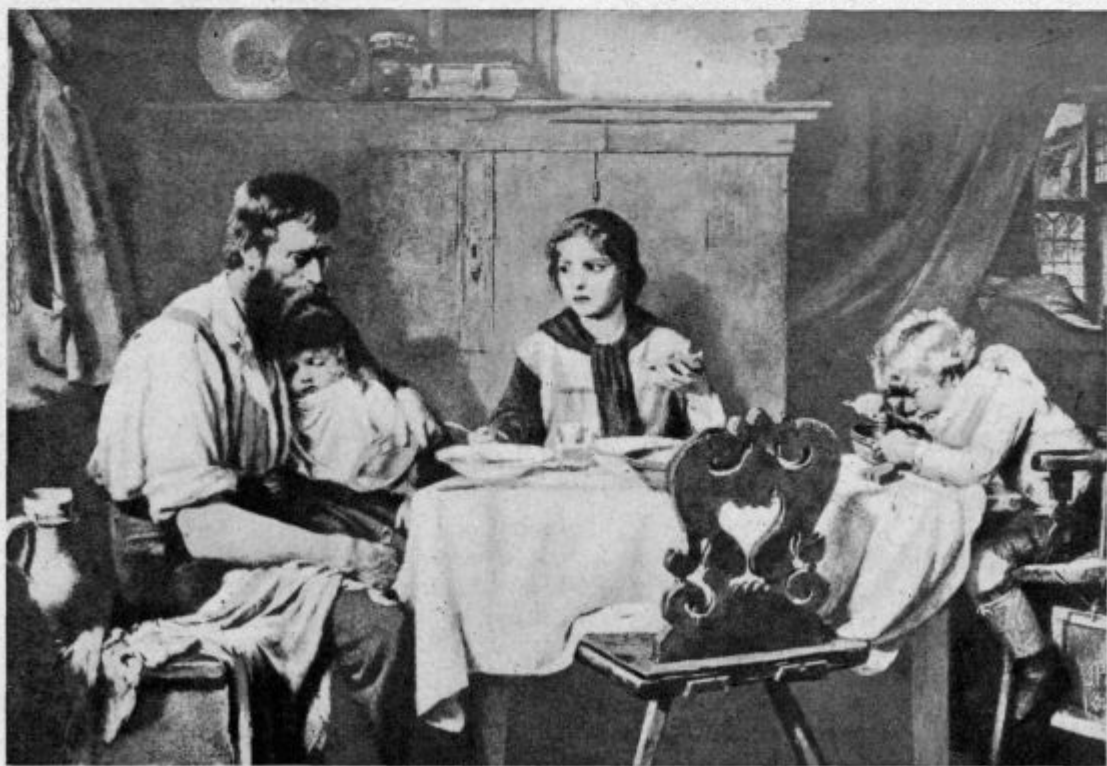
Mater so pokopali ...

»Saj to ni božja volja,« so mi rekli, »da bi se ljudje med seboj sovražili. In ni božja volja, da bi ljudje morali toliko trpeti. Ampak svet je zapustil Boga, ker pravi,