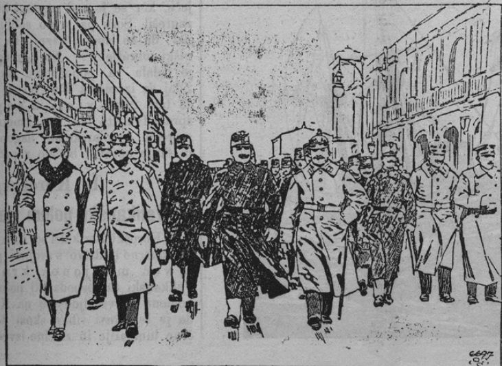
Ankunft d. österr. Militär-Kapelle d. 42. Infanterie-Regiments in Berlin

Vojaška godba avstrijskega infanterijskega regimenta št. 42 iz Theresienstadta je bila pred kratkem v Berlinu povabljena, da napravi tam par večjih koncertov. Godba je nastopila povsod z največjim uspehom. Naša slika kaže avstrijske vojake ob prihodu v Berlinu, sprejete od pruskih oficirjev.