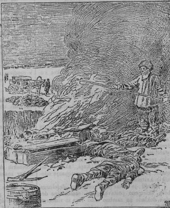
Verbrennung von Pestleichen in Erdgruben.

Prav hudo od kuge prizadeta je tudi pokrajina Mandžurija. Mrliči so v celih kupicah po cestah razloženi. Veliki mrz je preprečil, da bi segnili. Ali zdaj pribaja spomlad, mrz ponehava in treba je na kugi umrle mrliče proč spraviti. Zato so jih pričeli v Mandžuriji sežigati. V ta namen napravijo velike jame, v katere namečejo mrliče in jih sežgejo. Naša slika kaže to žalostno sežiganje. Baje se je že nad 10.000 mrličev sežgalo in še jih leži polno okoli. Evropski zdravniki so mnenja, da se bode grozovita kuga v spomladu po Kitajskem še huje razširila. V teh poldivjih pokrajinah manjka ravno vseh priprav, da bi se razširjenje kuge omejilo.