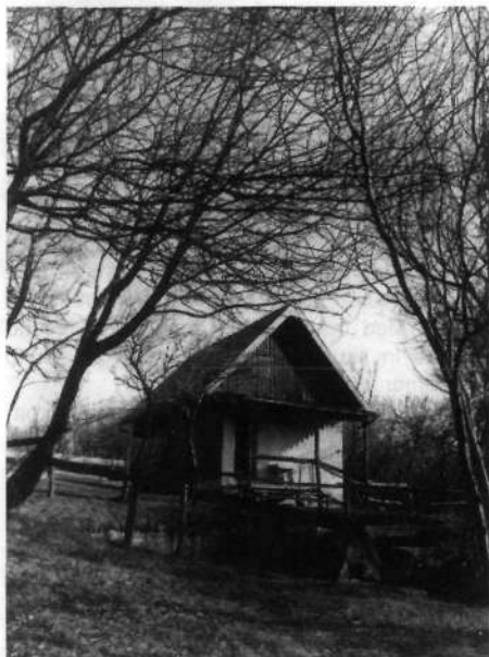
Zavetišče na Koradi

svoj vrhunec. Severno obzorje zastirajo Julijci, na vzhodu so prostrane planote predalpskega sveta, na jugu se nam oči za Goriškimi Brdi okopajo v Jadranskem morju, na zahodu pa se za silhueto Stare gore (Castelmonte) nad