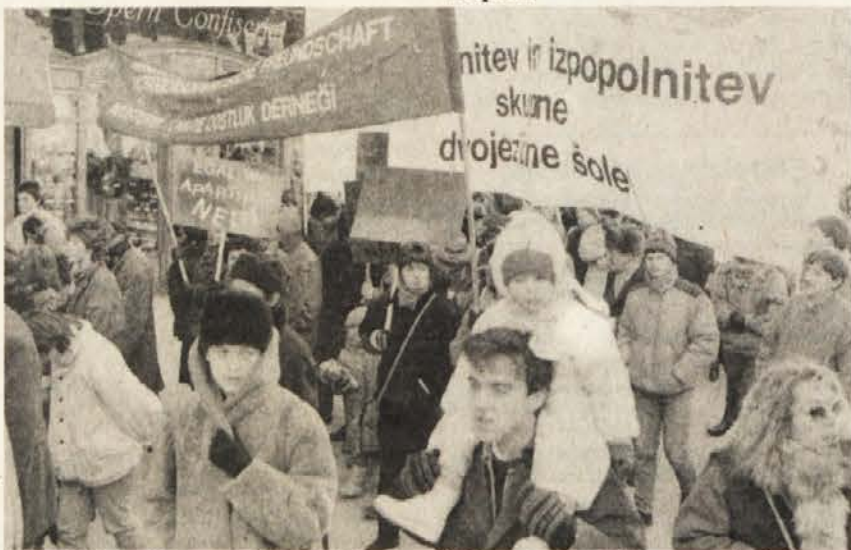
V številnih jezikih so stari in mladi demonstrirali za skupno šolo, za medsebojno razumevanje in sožitje.

vlado in vse parlamentarce, ne popustite tistim, ki bodo pri bodočih pogajanjih skušali izsiliti ločilni model, ki so ga sprejele koroške stranke. Dajte temu koroškemu ločilnemu partnerstvu nedvoumen odgovor. Zavrnite tako imenovano ‚koroško rešitev‘, kajti to ‚rešitev‘ podpira le majhen strankarski vrh, vseavstrijsko pa je ni mogoče zagovarjati. Kulturna raznolikost po tej poti ne sme biti uničena – Avstrija potrebuje svoje narodne skupine!“