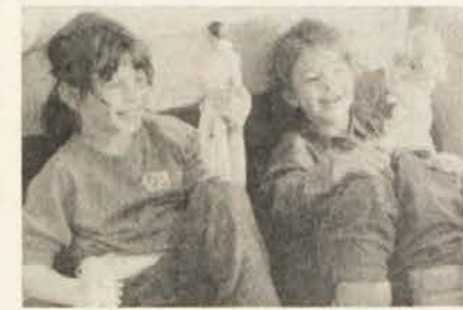
Otroci so se igrali, odrasli debatirali in peli.