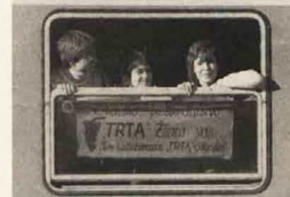
Udeleženci so bili dobre volje.