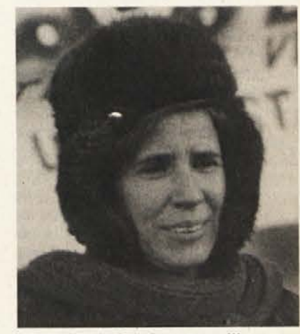
Beate Klarsfeld na demonstraciji na Dunaju.

V ostalem pa se mi zdi pomembno, da je demonstracija tako krepka, dopade se mi, da se „nova Avstrija“ tako angažira, saj je bila opozicija v Avstriji sicer bolj šibka.“