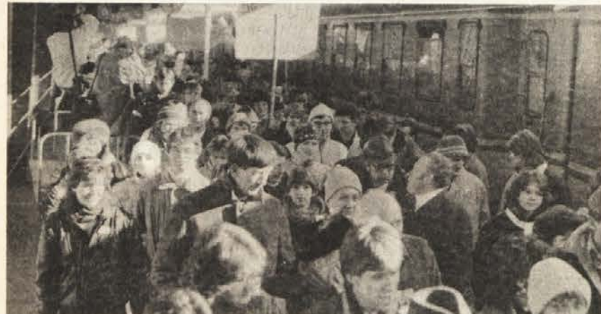
Skoraj pol kilometra dolg „protestni vlak“ je pripeljal 1500 koroških udeležencev na dunajsko demonstracijo.

Narodne skupine v Avstriji – je poudaril predsednik njihovega koordinacijskega odbora – se brezpogojno priznavajo k načelom sklepne listine Konference o varnosti in sodelovanju v Evropi. Zato odklanjajo vsako ločevanje v šoli in vzgoji ter se priznavajo k skupni vzgoji otrok večinskega naroda in narodnih manjšin v otroških vrtcih in k skupnemu pouku v osnovni šoli, ker je to pogoj za enakopravno integracijo v korist medsebojnega razumevanja, strpnosti in mirnega sožitja. „Narodne skupine v Avstriji ne želijo konfrontacije z državo, temveč želijo in zahtevajo le humanitarno in človekovim pravicam ustrezajočo rešitev svojih življenjskih vprašanj z dosledno izpolnitvijo vseh določil člena 7 državne pogodbe ter zagotovitev svojega obstoja in varstvo svoje identitete z zakonskimi ukrepi, ki odgovarjajo današnjemu mednarodnemu standardu pravic in zaščite narodnih skupin. Nočemo razdvajanja in ločevanja, hočemo mirno sožitje! Nočemo posebne šole za vsakega otroka, hočemo v skupni dvojezični domovini skupno dvojezično šolo in skupno vzgojo vseh otrok kot jamstvo za skupno srečno in mirno bodočnost!“