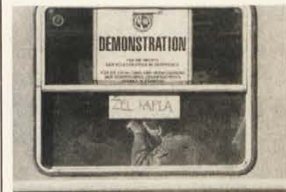
Eno izmed „okrašenih“ oken