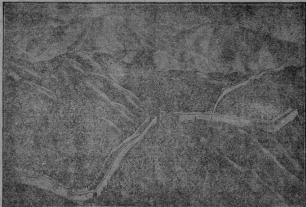
Kitajski zid, za katerega je pribežala kitajska armada iz Mandžurije pred Japonci. Zid je star nad 2000 let, 2000 km dolg, 7 m širok in visok 11 m.