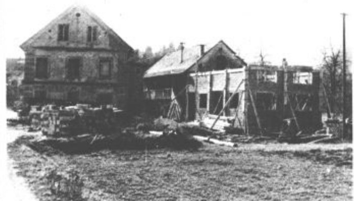
Z novimi trgovskimi in gostinskimi prostori bodo prebivalci Radmirja veliko pridobili

veliko prepotrebne dela. Pri tem z veseljem ugotavljajo, da niso imeli nobenih problemov v zvezi s pridobivanjem kandidatov za vse organe krajevne skupnosti. Velika večina predlaganih je pripravljena delati, kar utrjuje prepričanje, da bodo novi organi vsaj tako uspešni, kot so bili dosedanji.