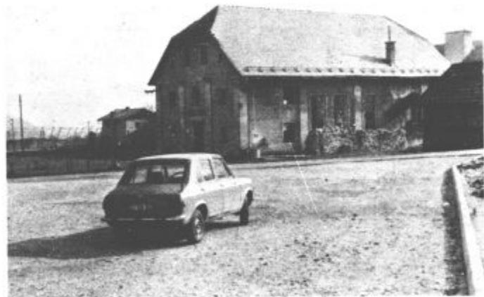
Gasilci uspešno obnavljajo nekdanjo šolo, skupaj s športniki in mladinci pa bodo ob njej uredili še parkirišče in športno igrišče