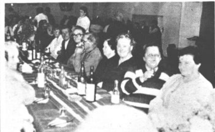
Tako veselo je bilo vse do večernih ur