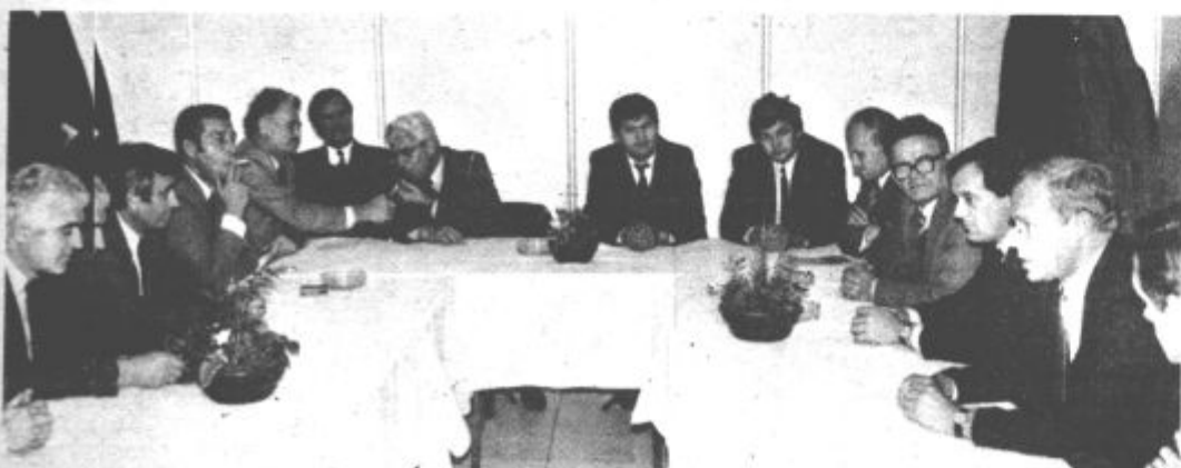
Pogovori predstavnikov Bihača s predstavniki Savinjskošaleške gospodarske zbornice, občine Velenje in in Gorenja