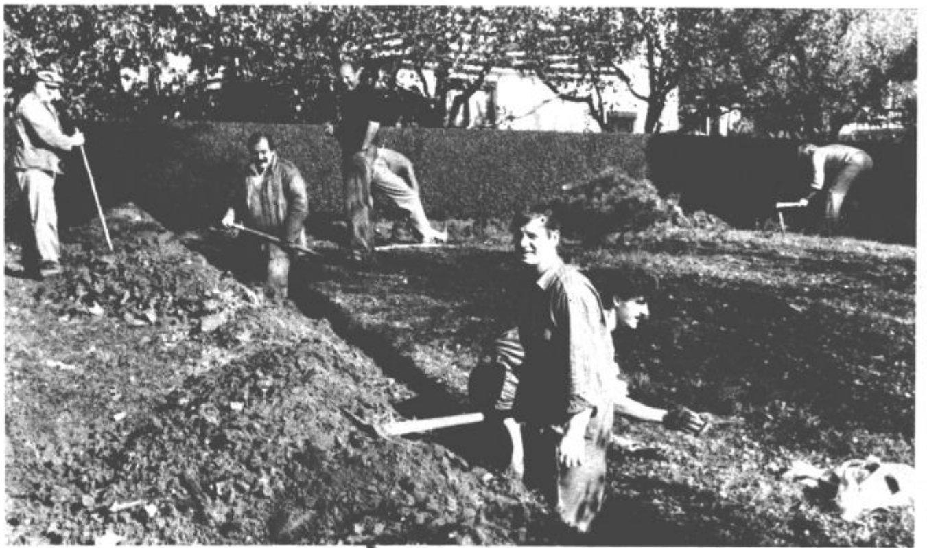
V krajevni skupnosti Šmartno v Titovem Velenju so začeli uresničevati velik projekt iz referendumskega programa — kabelsko televizijo.

Med drugim je predlagano, da bi bila v odloku opredeljena najnižja višina davka od obrtnih dejavnosti in sicer bi ta znašala 5 odstotkov od povprečnega letnega dohodka v gospodarstvu. Obrtniki, ki opravljajo dejavnosti, katere želimo v občini hitreje razvijati (te opredeljuje komite za planiranje, gospodarstvo in varstvo okolja) in bodo v razširjeno reprodukcijo vložili več kot 60 odstotkov povprečnega osebnega dohodka v gospodarstvu, naj bi imeli priznanih odslej 50 odstotkov olajšav (doslej 45 odstotkov). Predlagano pa je še, da bi se davek iz avtorskih pravic znižal od 20 na 10 odstotkov, davek od dela kinooperaterjev pa od 40 na 10 odstotkov. (mz)