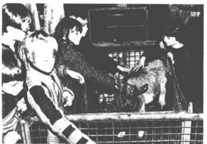
Otrokom so bile všeč vse razstavljene živali, vse so si z zanimanjem ogledovali, kakšno so celo pobožali, najbolj navdušeni pa so bili nad kozami. In če so se kakšne lahko še dotaknili, je bil to zanje dogodek dneva.