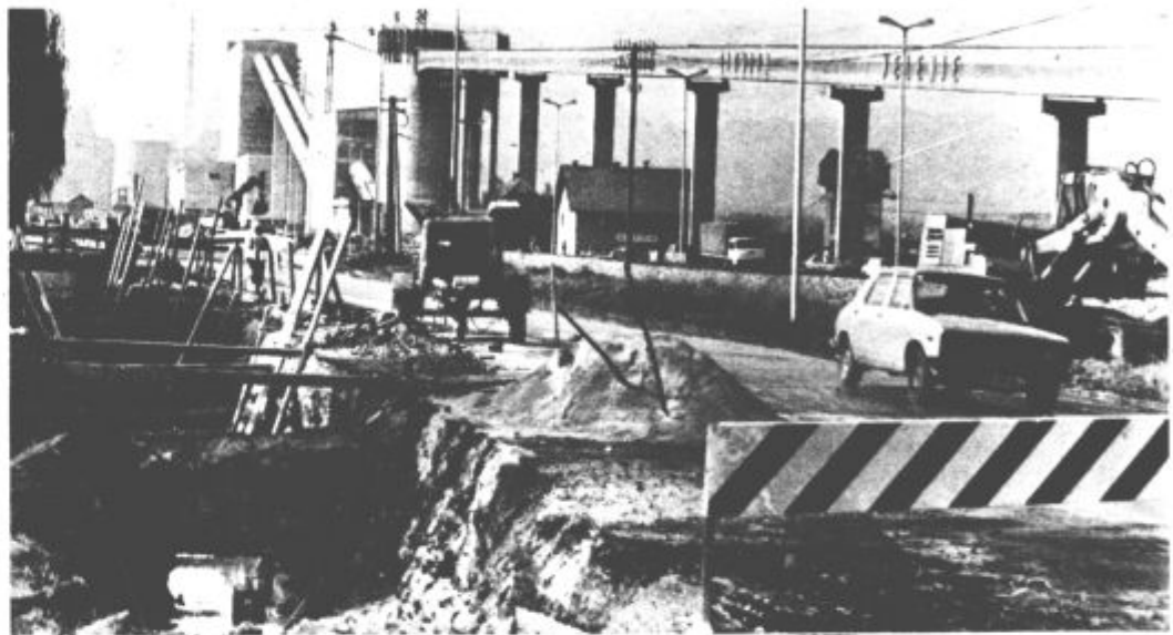
Veliko nejasnosti okrog javnega prometa skozi Pesje je po četrtkovem zboru krajanov pojasnjenih.

Predvideno je bilo, da bodo obnovitvena dela končana do začetka letošnjega novembra. Vendar so se zavlekla pri polaganju cevovoda. Denar s strani RLV-ja za priključek ceste na Partizansko še ni nakazan izvajalcu Cestnemu podjetju Celje, bo pa, ko bodo ti pričeli z delom. Zakaj še niso pričeli delati? Na to vprašanje ni bilo moč dobiti odgovora,