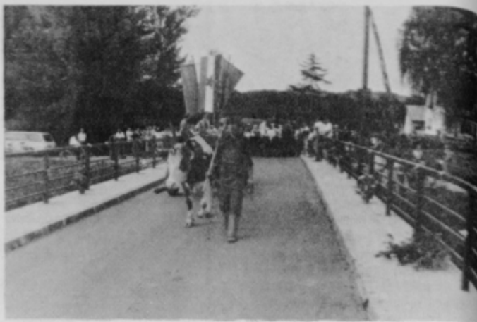
Kmečke žene iz Zamušanov s Šeko prve krstile nov most