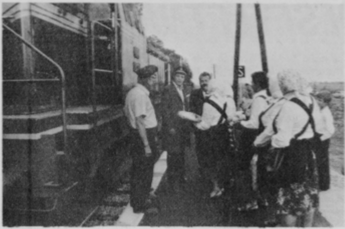
Venec lüka in gibanica za strojevodjo