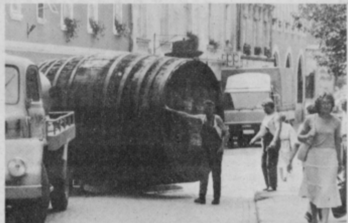
Veliko potrpežljivosti in spretnosti je bilo potrebno, da so stari sodi in preša dobili novo klet, tokrat na prostem.