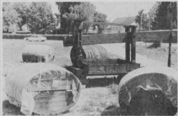
Nasproti magistralne ceste Maribor—Ormož nastaja nova vinarska zbirka.

Na tem prostoru bomo lahko vinogradniki in vinarji tudi občasno pripravljali kakšne prireditve kot so martinovanje in običaji ob trgatvi.