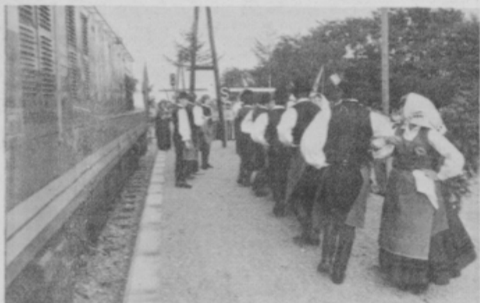
Na slovesnosti ob prvem postanku vlaka je nastopila tudi folklorna skupina iz Cirkovec

«Svet KS Cirkovec je sprejel sklep, da se bo v letu 1983 gradilo železniško postajališče v Šikolah, seveda s pogojem, da največ sredstev prispevajo vaščani sami. Gradbeni odbor ni imel lahke naloge, saj je moral reševati probleme z Železniškim gospodarstvom, KS in vaščani