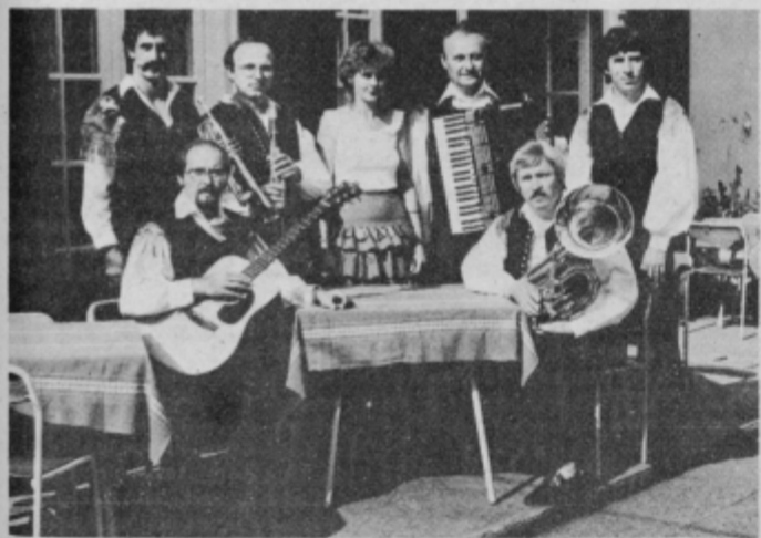
Ptujski instrumentalni ansambel pred grajsko restavracijo v Ptuj