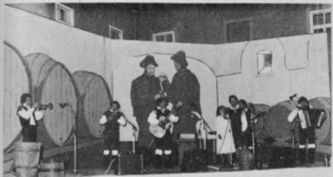
Slovenskogoriški kvintet na lanskem festivalu