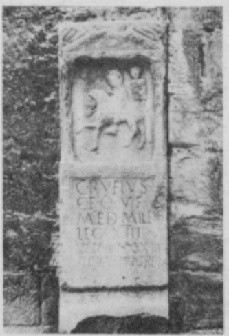
Nagrobnik Gaju Rufiju, severna stena stolpa proštirske cerkve, sreda 1. stoletja našega štetja, foto: Vernik.

C(aius) Rufius C(ai) f(ilius) Ouf(entina) Med(iolano) miles leg(ionis) XIII Gem(inae) an(norum) XXXVI st(i)p(endiorum) XVI fratres pos(uit) h(ic) s(itus) e(st)