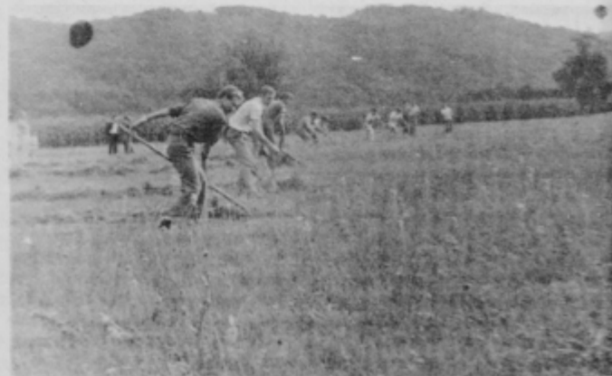
Fantje so se pomerili v ročni košnji

četrtega krajevnega praznika KS Dolena so potekale v soboto, pričeli pa so jih z otvoritvijo mostu prek Dravinje v Zgornji Pristavi. Most je velikega pomena za prebivalce na obeh straneh Dravinje povezuje pa Zgornjo Pristavo s haloškimi naselji v sosednji krajevni skupnosti Podlehnik. Most so zgradili z združenimi sredstvi območne vodne skupnosti, skupnosti za ceste občine Ptuj, TOZD Gozdarstvo, TOK Gozdarstvo in krajevnih skupnosti Dolena.