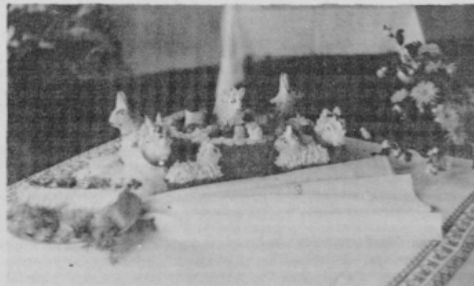
Gospodinjice so pripravile zanimivo razstavo pekaških mojstrovini ter ročnih izdelkov.