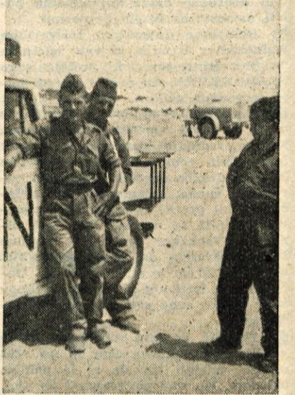
S tovariši v puščavi

Ko smo prispeli v Port Said, so bile obiskali El Šato, kjer so grobovi med tam še vedno angleške in francoske vojno umrlih Jugoslovancev. Grobove enote. Port Said je bil popolnoma prazen. Videli smo le dva človeka v civilnih oblekah na nekem balkonu, 15. januarja smo odšli na pot. Od-