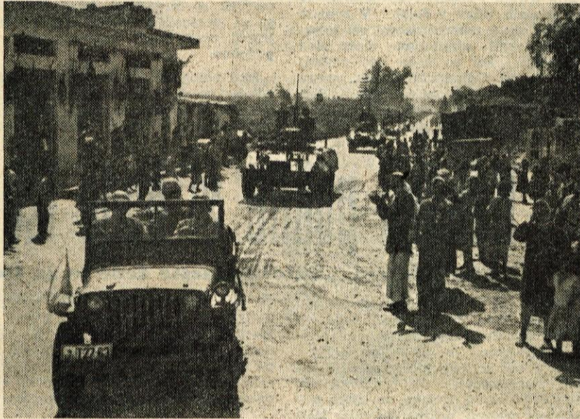
Prihod naših čet v Gazo

Med nami in Egipčani se je kmalu skovalo zelo tesno prijateljstvo. Drug drugega smo učili svojega jezika. Ko smo odhajali, so nas že pozdravljali naši egiptovski tovariši z »zdravo« in »nasvidenje«. Tudi mi smo jim že znali odgovoriti s »saïda«, kar bi po naše pomenilo zdravo.