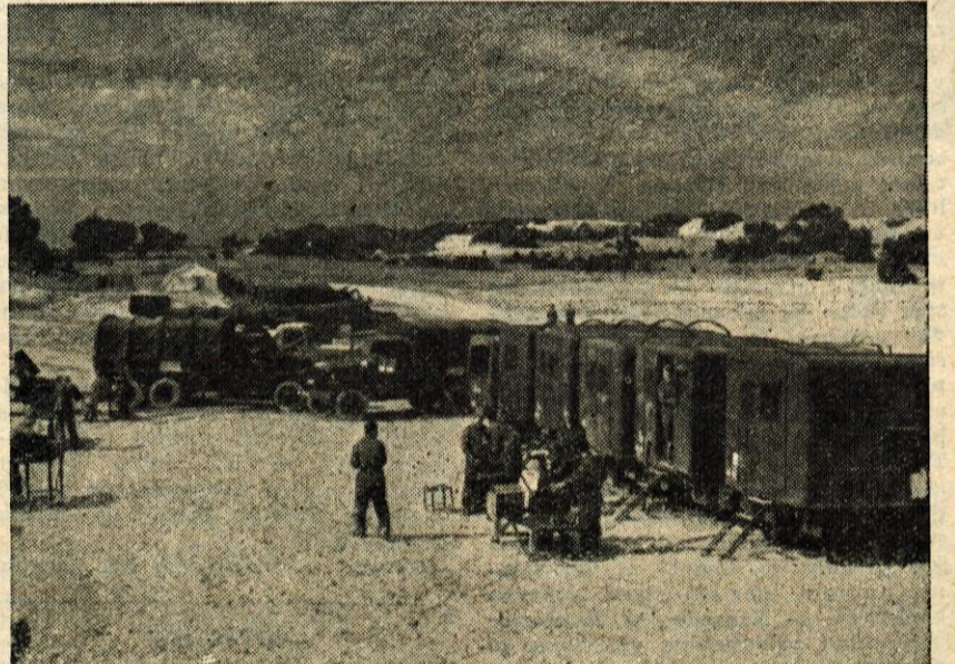
Delavnica naših motoriziranih enot na Sinajskem polotoku

šli smo v El Ariš. Sprejema, ki so nam ga tu pripravili Egipčani, ne bom nikoli pozabil. Ko smo prišli v mesto, so ljudje skakali na naša vozila, nas objemali in poljubljali, poljubljali so