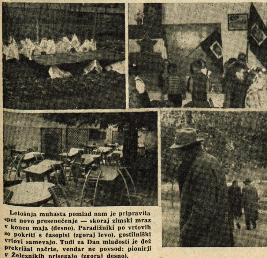
Letošnja muhasta pomlad nam je pripravila spet novo presenečenje — skoraj zimski mravz v koncu maja (desno). Paradižniki po vrtovih so pokriti s časopisi (zgoraj levo), gostilniški vrtovi samevajo. Tudi za Dan mladosti je dež prekrižal načrte, vendar ne povsod: pionirji v Zeleznikih prisegajo (zgoraj desno).