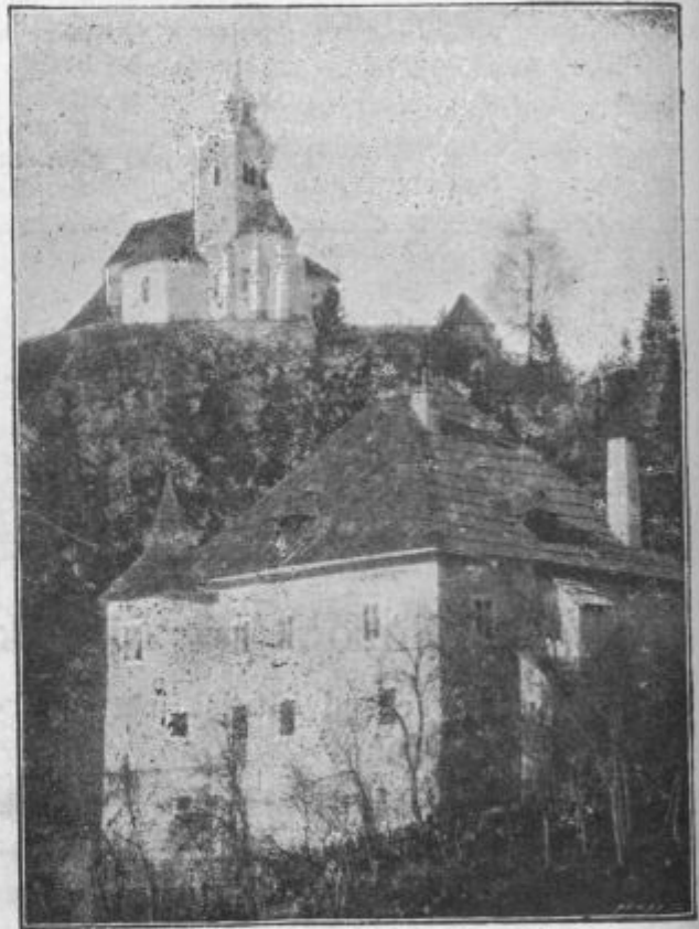
Veliki Strmec od južne strani.

Za izveličanje neumrjajočih duš navdušeni misijonarji ne puste nobene prilike, ako se jim