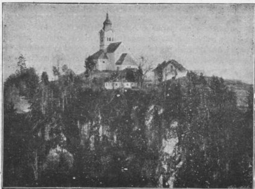
Veliki Strmec od severa.

bodisi zavodov, bodisi ljudi, ki bivajo po teh zavodih, si lahko misliš, koliko skrbi, kje dobiti sredstev, da se tak potreben zavod ustanovi. Ko se pa ustanovi, kje vzeti, da se pokrijejo obilni stroški za vzdrževanje. Veliko stori Rim, propaganda, sv. Oče. Toda Rim ima malo. Misijonov je pa toliko po vseh delih sveta. Iz tega sledi, kako zelo potrebujejo katol. misijoni podpore. Pa tudi, kako veliko dobro delo naredi, kdor položi kak darček na misijonski oltarček. Gotovo ga položi na stokratne obresti v hranilnici „Gospoda vinograda“. In ko bode treba položiti račun od sprejetih talentov, pokazal bode lahko strogemu gospodarju hranilnično knjižico misijonske družbe, češ: glej, Gospod, én talent, malo premoženja, si mi dal, pa sem Ti ž njim 100 drugih pridobil. In Gospod vinograda bode vesel rekel: „Prav, zvesti in modri hlapec, ker si bil v malem zvest, postavil te bodem nad veliko: Pojdi v veselje svojega Gospoda!“