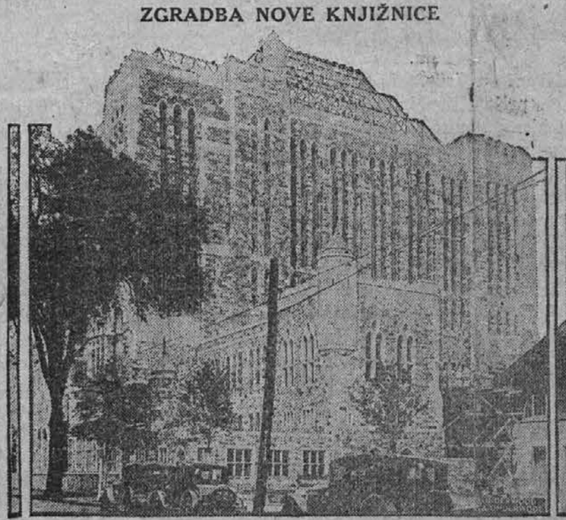
ZGRADBA NOVE KNJIŽNICE Ko bo poslopje, ki ga vidimo na sliki, dogotovljeno, bo predstavljalo eno izmed najboljših in najbogatejših opremljenih knjižnic na svetu. Zgradba se imenuje "Sterling Memorial Library" in je last Yale university.

New York, N. Y. — Poroča se, da je odpuljo na parniku Chateau Thierry 150 vojaških inženirjev Nikaragvo, kjer bodo pregledali in proučili možnost podvzetja nikaragvanskega prekopa, med Atlantikom in Pacifikom, za katerega se Zdr. države že dalj časa zanimajo.