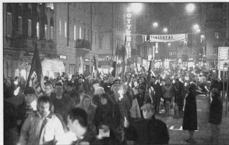
Baklada proti rasizmu v Trstu - s figo v žepu?

V teh dneh je na obisku v Trstu predsednik italijanske republike Carlo Azeglio Ciampi. Do tega obiska prihaja v času, ko je še vedno prisotna polemika ob zadržanju deželne uprave Furlanije-Juljske krajine pa tudi tržaškega župana do vstopa svobodnjaške stranke Jörga Haiderja v avstrijsko zvezno vlado.