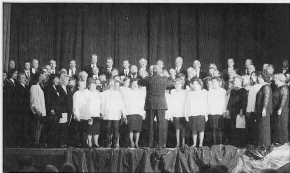
Prešernova proslava breških kulturnih ustvarjalcev v Boljuncu

Na Tržaškem se še dalje vrstijo številne Prešernove proslave ob dnevu slovenske kulture, ki jih prirejajo tukajšnja slovenska društva in krožki. O nekaterih proslavah smo prejeli posebej poročila, primerno pa je, da zabeležimo tudi nekaj drugih, ki so navdse uspele.