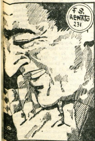
F. S. AENATO 231

V nedeljo pa so se v spominski tekmi srečali igralci predvojnega Slovana in povojnega fizikulturnega društva Naklo. V zanimivi tekmi je zmagal Slovan z 1:0. T. K.