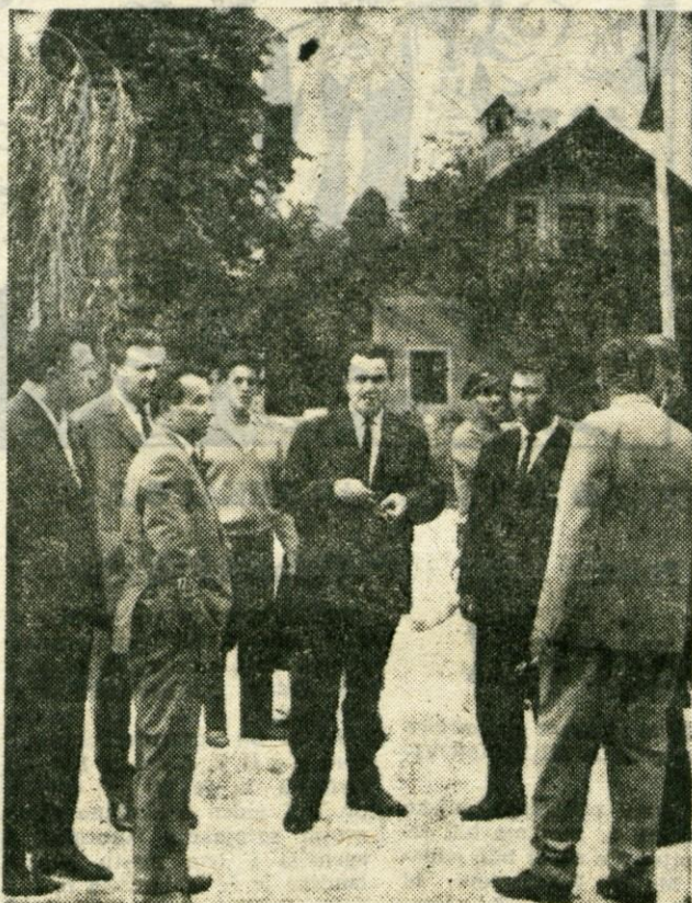
Gostje pred otvoritvijo vodovoda v Zalogu

razširitve vodovoda Kranj z okolico je iz zbiralnega rezervoarja Trata usmerjen glavni vod proti Srednji vasi, kjer se pred vasjo razcepi in usmerja glavno vejo proti vasi Britof in preko Primškovega do stolpnega rezervoarja v Kranju, z drugo vejo pa preko Senčurja in dalje proti vasem Voglje—Voklo—Prebačevo do rezervoarja pri Smedniku. Ko bo dograjeno in priključeno celotno planirano omrežje tudi na levem in desnem bregu Save, ne bo z vodo več takih težav, kot jih marsikje danes še imajo!