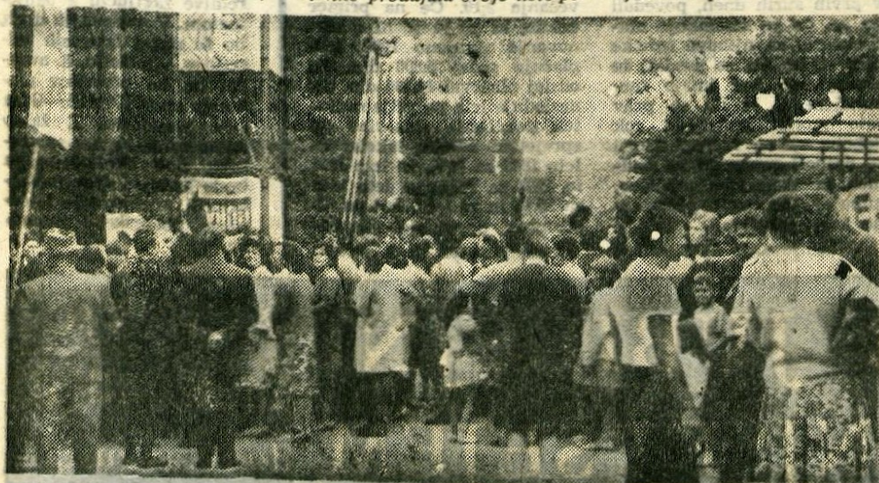
Kljub slabemu vremenu je 15. jubilejni Gorenjski sejem obiskalo do ponedeljka večer že 22.400 ljudi

Skopje, 3. avgusta — Včeraj so v glavnem mestu Makedonije odprli tradicionalni skopski sejem vzorcev, izdelkov in reprodukcijskega materiala. Na sejm sodeluje z okoli 3200 razstavnimi predmeti nad 120 razstavljalcev.