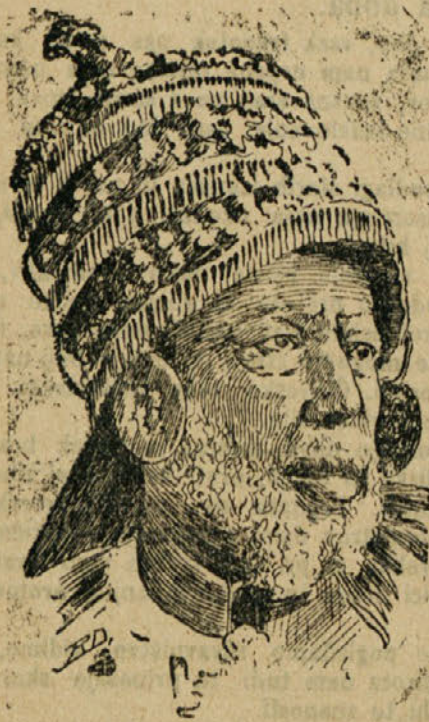
Abesinski cesar Menelik.

Zato so se začeli izpraševati mnogi učenjaki, kdaj se bo to zgodila. Po statistiki profesorja A. Briuza se more ceniti množina uporabljive železne rude na zemlji na 9000 milijonov ton; od tega odpade 2200 milijonov ton na Nemško, 1500 milijonov na Rusko in Francosko, 1100 milijonov na ameriške Zvezne države, 1000 milijonov na Švedsko, 500 milijonov ton na Anglesko. Ako je za 50 milijonov ton letne železne produkcije, treba 100 do 150 milijonov ton železne rude, se bo izčrpala vsa zaloga železne rude pred koncem 20 stoletja. Vendar pa, ako pomislimo na velikanske pokrajine naše zemlje, ki še niso preiskane, koliko imajo v sebi rude, je razmišljanje gori omenjenega profesorja nekoliko preveč pesimistično, tudi ker ni mislil na možnost, da bi se v potrebi rabilo tudi ono rudo, ki je sedaj niso izrabljali zaradi premajhne vsebine železa, a takih rud je silno mnogo. Nabaja se tudi pri nas v precejšnji množini.