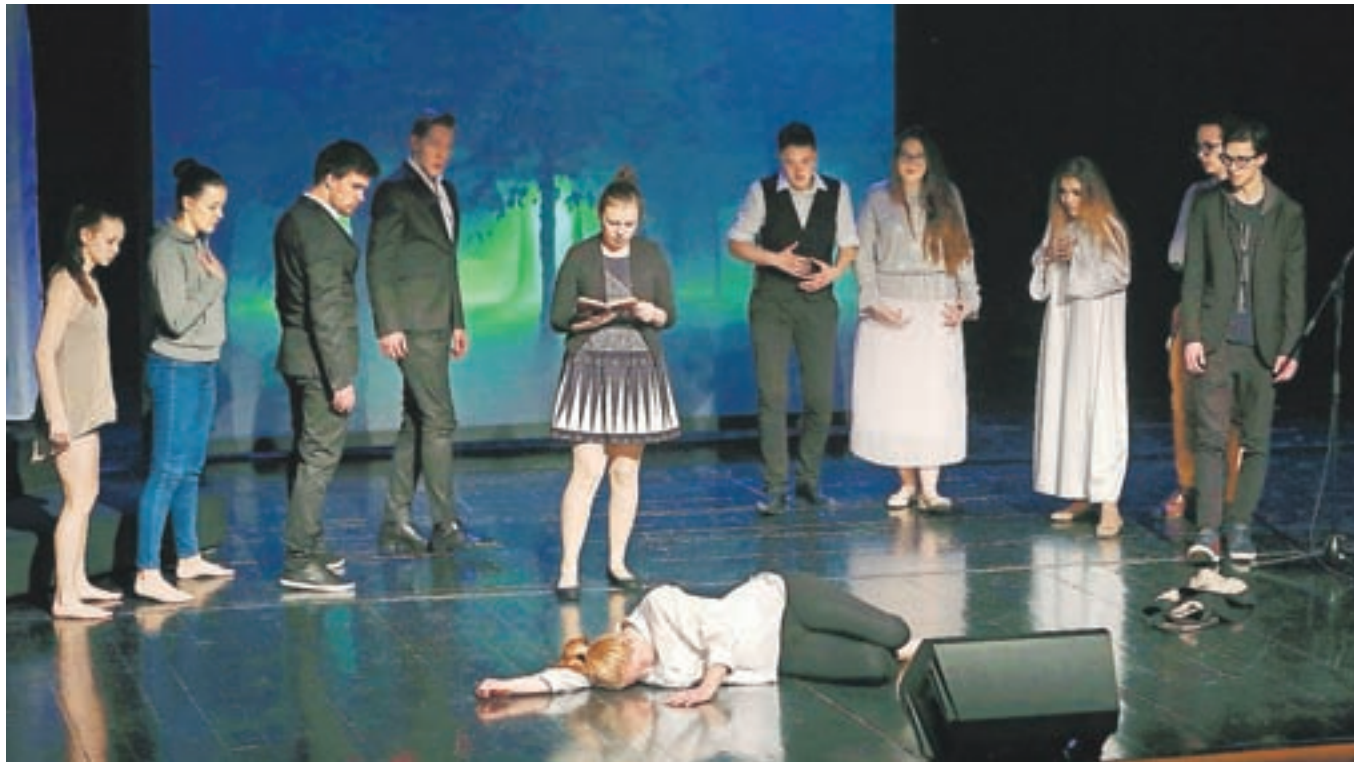
Kamniški dijaki so na občinski proslavi znova navdušili s svojim glasbeno-gledališkim recitalom.

V dneh okoli slovenskega kulturnega praznika se je tudi v občini Kamnik zvrstila vrsta kulturnih prireditev. Obiskali smo tri: osrednjo občinsko proslavo v Domu kulture Kamnik, srečanje s pisateljico Nežo Maurer v zavodu Cirius in prireditev Glasbene šole Kamnik.