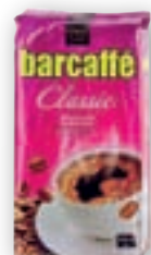
kava Barcaffé 250 g