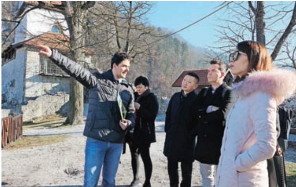
Predstavniki kitajske turistične agencije so se povzpeli tudi na Mali grad ...