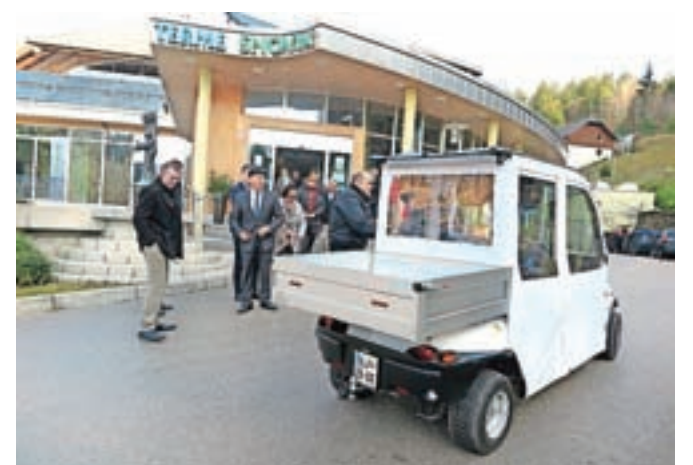
Nova pridobitev je požela veliko zanimanja.