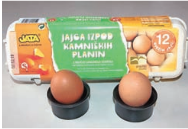
Jajca izpod Kamniških planin so z geografsko označbo zaščiteni v Sloveniji in v Evropski uniji.

Na pobudo Jate Emone so ustanovili Združenje proizvajalcev jedilnih jajc izpod Kamniških planin, ki je tudi dalo pobudo za zaščito teh jajc z zaščitenim geografsko označbo. Ministrstvo za kmetijstvo, gozdarstvo in prehrano je postopek zaščite končalo leta 2006, ob koncu leta 2015 pa je s predložitvijo vloge Evropski komisiji začelo še postopek za zaščito teh jajc na ravni Evropske unije. Združenje šteje šest članov,