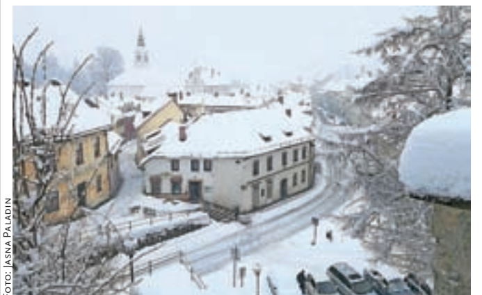
Snežna odeja se je v sredo takole debelila tudi po nižinah.

pol metra, v gorah, kjer velja tudi velika nevarnost snežnih plazov, pa celo meter. V sredo ga je v nižinah zapadlo še kakšnih deset centimetrov, k sreči pa kljub napovedanemu snegolomu hujših posledic v občini ni bilo.