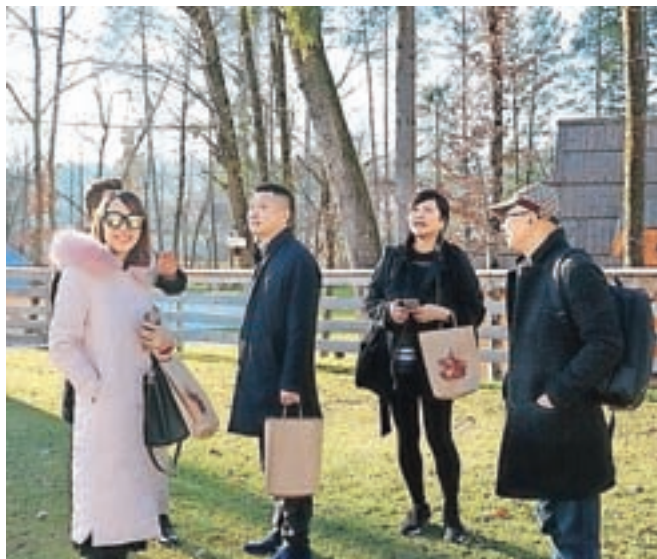
in obiskali turistično naselje Slovenia Eco Resort v Godiču.