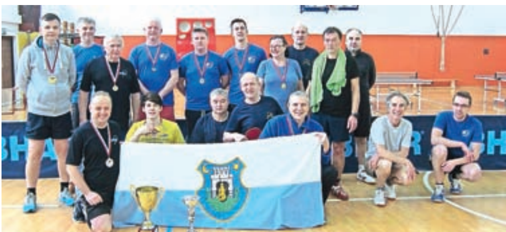
Najboljši igralci medobčinske namiznoteniške lige Kamnik 2018

Člani Namiznoteniškega kluba Kamnik se trudimo za razvoj te lepe, dinamične in zanimive športne panoge in vas prijazno vabimo na ogled naših tekmovanj.