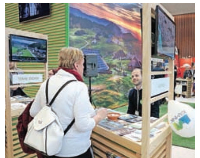
V ospredju letošnjega sejma je bil zeleni in aktivni turizem, kar so predstavljali tudi predstavniki Zavoda za turizem, šport in kulturo Kamnik.

Kamnik – Na osrednjem turističnem sejmu v Sloveniji Natour Alpe-Adria, ki je na Gospodarskem razstavišču v Ljubljani potekal od srede, 31. januarja, do sobote, 3. februarja, se je kot turistična destinacija predstavila tudi občina Kamnik, in sicer na dveh lokacijah. V Stekleni dvorani so se predstavila kamniška turistična društva in tudi nekateri kamniški ponudniki, v Marmorni dvorani na osrednji stojnici, poimenovani Zelena vas, pa je Kamnik kot destinacijo predstavljal Zavod za turizem, šport in kulturo Kamnik, posebej pa so se predstavile tudi Terme Snovik. J. P.