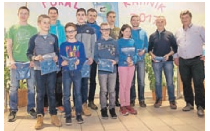
Udeleženci vseh petih tekov lanske sezone tekaškega pokala Občine Kamnik