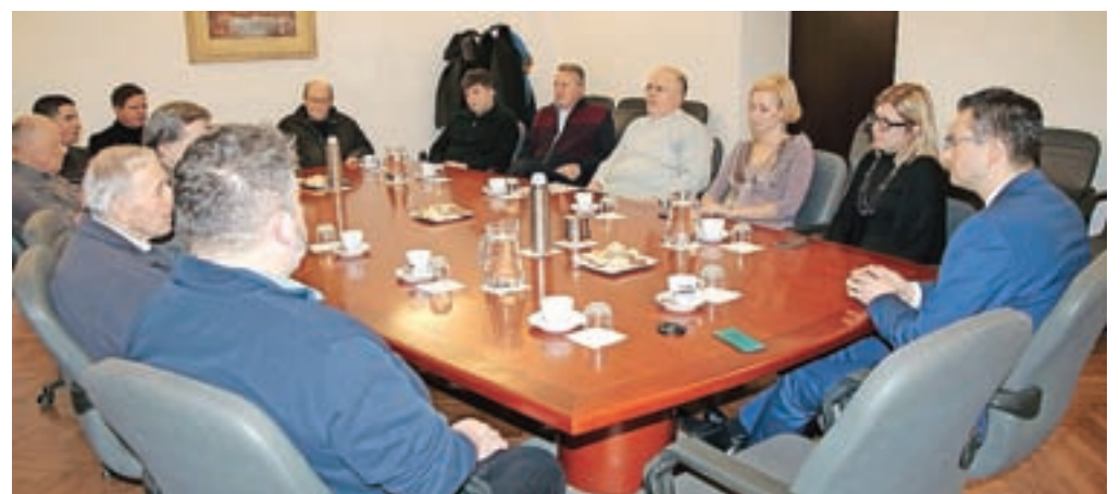
Tradicionalnega srečanja z županom se je udeležilo deset duhovnikov, ki svoje pastoralno delo opravljajo na območju občine Kamnik.

V sproščenem srečanju so sodelavci občinske uprave župnike seznanili z delom v minulem letu in z načrti v letošnjem pa tudi s tem, da bo v prvi polovici februarja objavljen javni razpis za sofi-