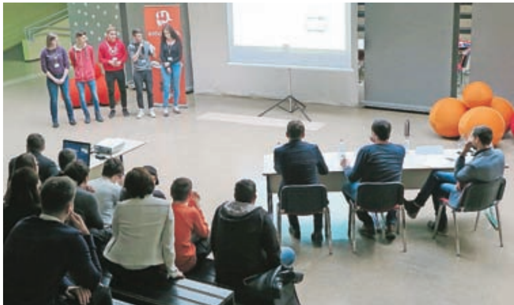
Na Ustvarjalnikovem Startupu je sodelovala tudi ekipa kamniških srednješolcev programa Ekonomski tehnik, ki je razvila in predstavila aplikacijo Rezervacija.

primer dobre prakse za zgled postavil prav občino Kamnik, saj takšna podpora podjetništvu po občinah (še) ni samoumevna. »Vedno znova ugotavljamo, kako podjetništvo nima starostne omejitve. Zelo sem vesel, da dogodki, kakršen je ta današnji, tlakujejo pot tej mladi generaciji. Vsi, ki ste sodelovali, ste v resnici zmagovalci, saj se največji uspehi ne gradijo zgolj ob zmagah. V poslu namreč uspejo le tisti, ki znajo preko neuspeha priti do uspeha,« je dejal ob zaključku druženja.