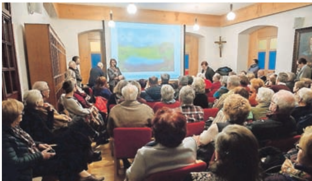
Nedavno predavanje v Franciškanskem samostanu je naletelo na izjemen odziv poslušalcev, zato ga bodo kmalu ponovili.