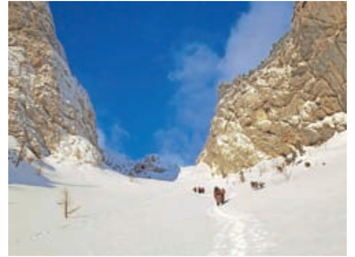
Proti Kokrskemu sedlu / FOTO: F. LAJMIŠ

S pohodom se člani kamniškega alpinističnega odseka vsako leto spomnijo prijateljev, ki so svoje življenje izgubili v gorah.