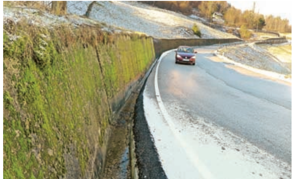
Jarek ob cesti na Črnivec je potreben zaradi vode, ki stalno priteka iz hriba.

O letošnjih investicijah pa: »Na cesti Kamnik–Gornji grad čez prelaz Črnivec se