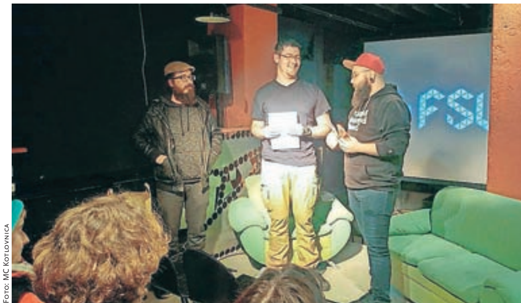
Najboljšim na Festivalu svobodne video produkcije so znova podelili zlate ribice.

Tokrat so jih prejeli: igrana filma Štokholm (režija Luka Štigl) in Zrasla si bom krila