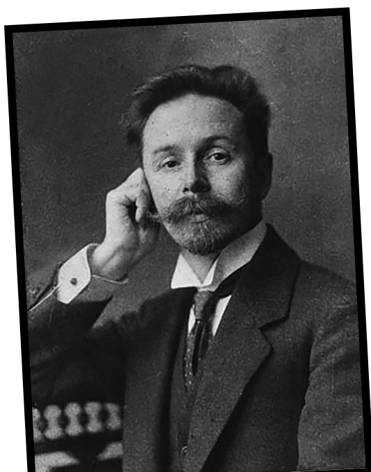
A. N. Skrjabin, Wikipedija

Ruski pianist in skladatelj je bil rojen 6. 1. 1872 v Moskvi, kjer je 27. 4. 1915 tudi umrl. A v vseh svojih 43. letih življenja (od tega je bil 25 let pianist in skladatelj) je naredil veliko. Četudi so